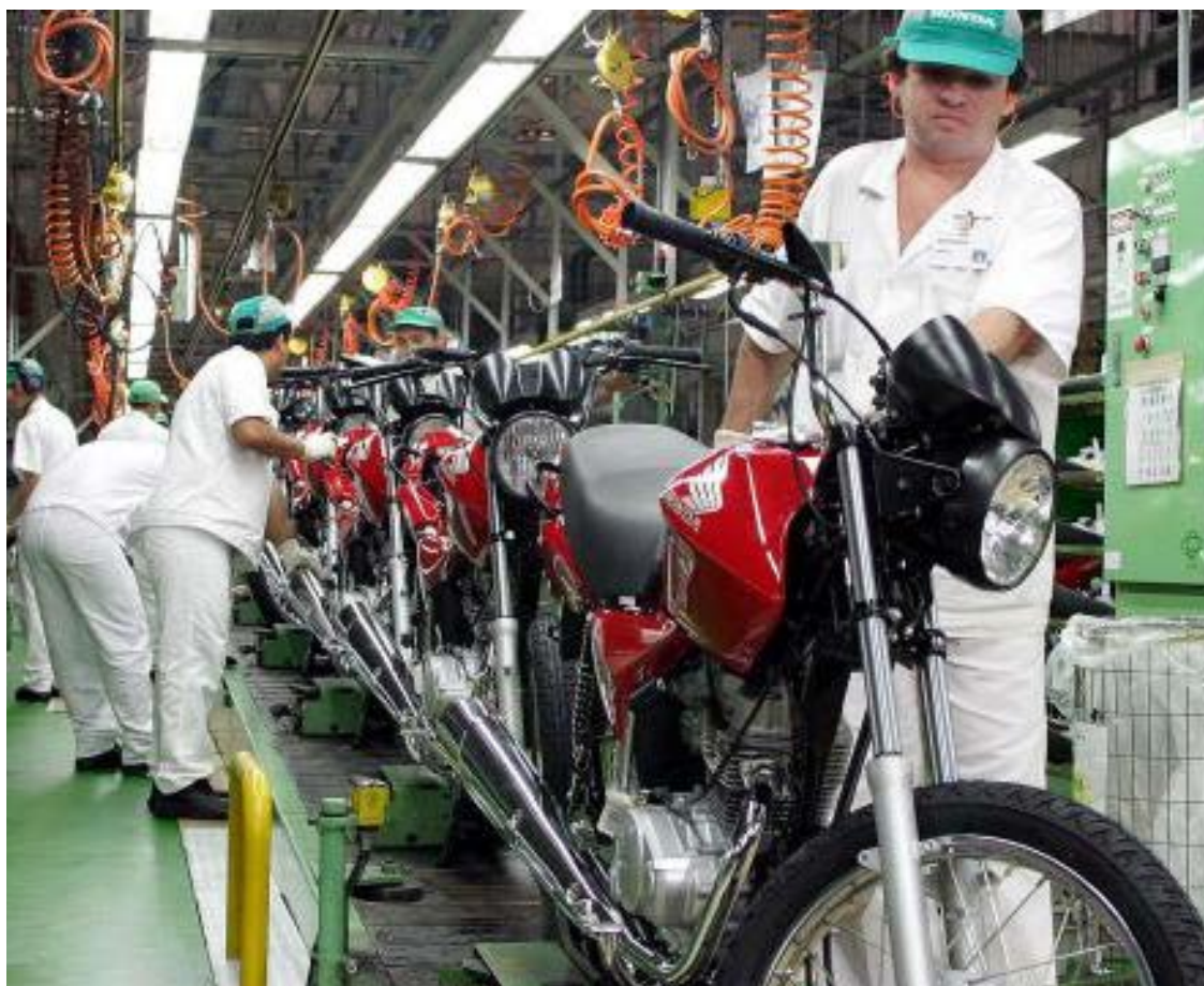
Em 2016, 26% da população trabalhava em empresas de grande porte

O percentual daqueles que trabalhavam em empreendimentos de pequeno porte (com até 5 pessoas) subiu de 48,1% para 50,1% entre 2015 e 2016. "Nesse período em que nós observamos, por exemplo, queda na ocupação da indústria - até mesmo as de grande porte tiveram dispensas de trabalhadores