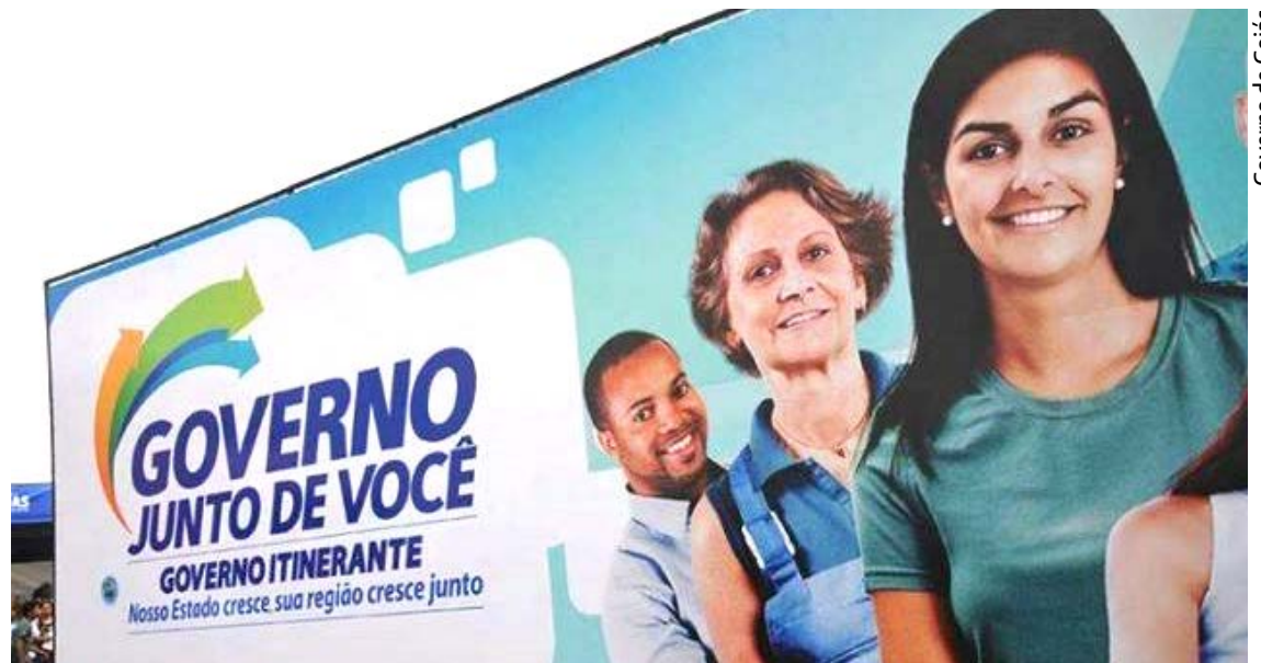
Governo de Goiás

Já foram realizadas 58 edições do programa em 28 cidades goianas entre abril de 2013 e julho de 2017, somando mais de 3,75 milhões de atendimentos realizados. Agora, a expectativa é de aumento do número de pessoas atendidas.