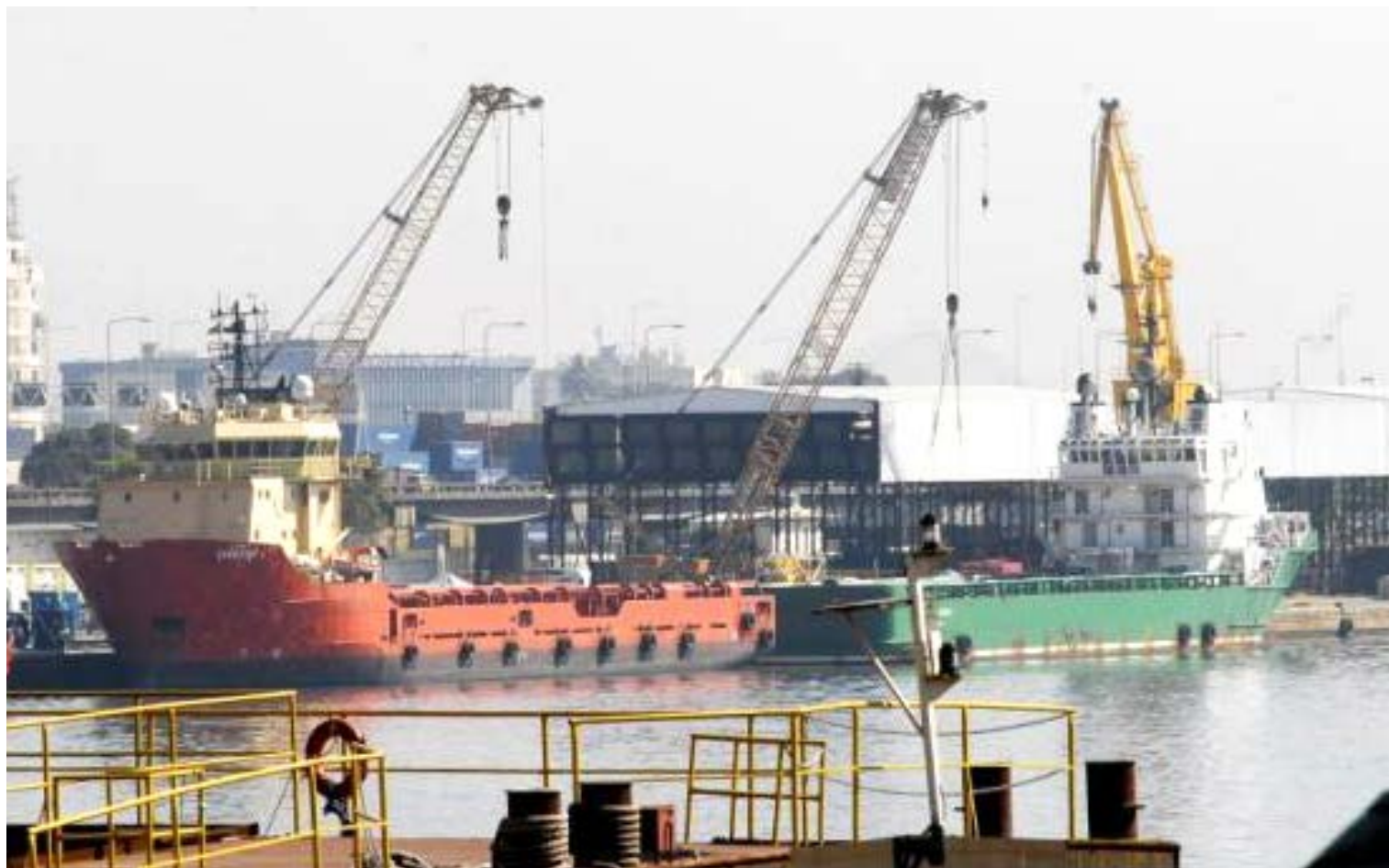
Exportações e importações movimentam portos brasileiros. Em setembro, principal alta no volume exportado ficou com a agropecuária (94,5%)

Entre as três atividades econômicas pesquisadas, a principal alta no volume exportado entre setembro de 2016 e setembro deste ano foi observada na agropecuária (94,5%). As exportações da indústria extrativa cresceram 7,3% e as