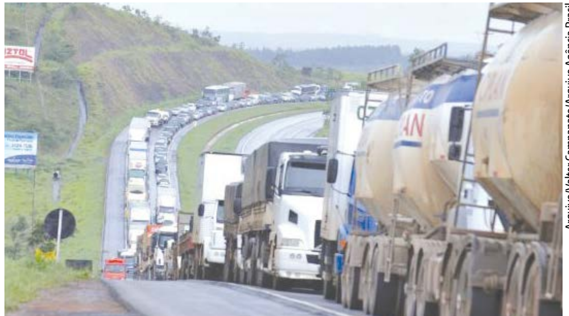
O indicador de qualidade das rodovias brasileiras é relativo ao primeiro semestre de 2017

Dos 52 mil quilômetros de rodovias federais analisados, 4,8 mil não estão cobertos por