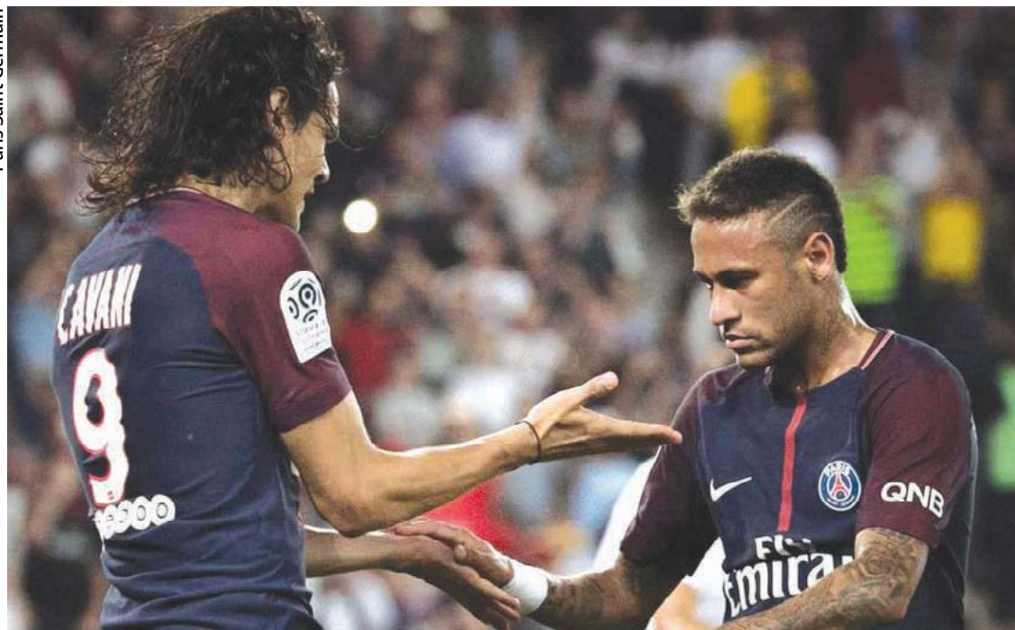
Paris Saint Germain

A confusão entre Neymar e Cavani no último mês, que discutiram em campo ao decidir quem bateria as jogadas de bola parada, ainda está rendendo. Após os jogadores se acertarem e continuarem a brilhar pelo PSG, o uruguaio se pronunciou sobre o caso.