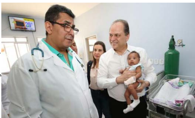
Ministro da Saúde, Ricardo Barros visita hospitais em Janaúba e Montes Claros

O ministro da Saúde, Ricardo Barros, visitou os hospitais de Janaúba e Montes Claros, em Minas Gerais. As unidades de saúde prestam assistência às vítimas da tragédia na creche Gente Inocente, localizada na cidade de Janaúba. Há uma semana, um incêndio levou a morte de 11 pessoas, das quais nove crianças, uma professora e o segurança da instituição, responsável por atear fogo no local.