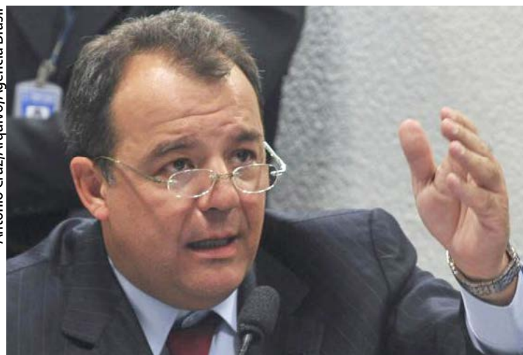
Ex-governador Sérgio Cabral foi condenado a 45 anos e dois meses de prisão pelos crimes de corrupção passiva, lavagem de dinheiro e organização criminosa