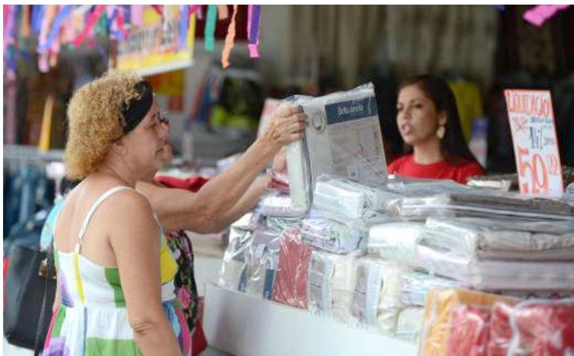
Banco Central anunciou que economia deve crescer 0,7% este ano, graças ao desempenho do Produto Interno Bruto

O relatório do Banco Central lembra que “houve também o efeito temporário positivo dos saques das contas inativas do Fundo de Garantia do Tempo de Serviço (FGTS)”. A estimativa para