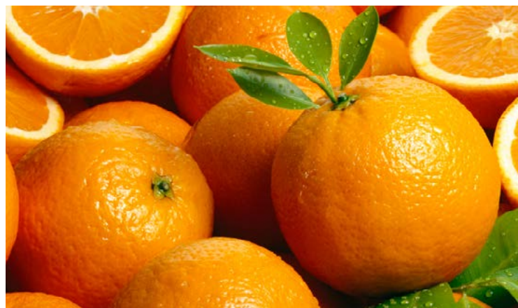
Brasil produziu 17,2 milhões de toneladas da laranja em 2016

O estado de São Paulo respondeu por 30,9% do valor de produção nacional da fruticultura, o que significou R$ 10,3 bilhões, com destaque para a cultura da laranja (59,2%). Por municípios, a liderança ficou com Petrolina (PE).