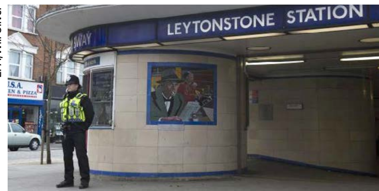
Polícia Metropolitana de Londres explicou que o jovem, de 17 anos, foi detido em uma residência de Thornton Heath, no Sul da cidade

Um sexto suspeito de ter alguma ligação com o atentado ocorrido no último dia 15, em um vagão do metrô de Londres, foi preso, como revelou na última quinta-feira (21) a Polícia Metropolitana de Londres (MET).