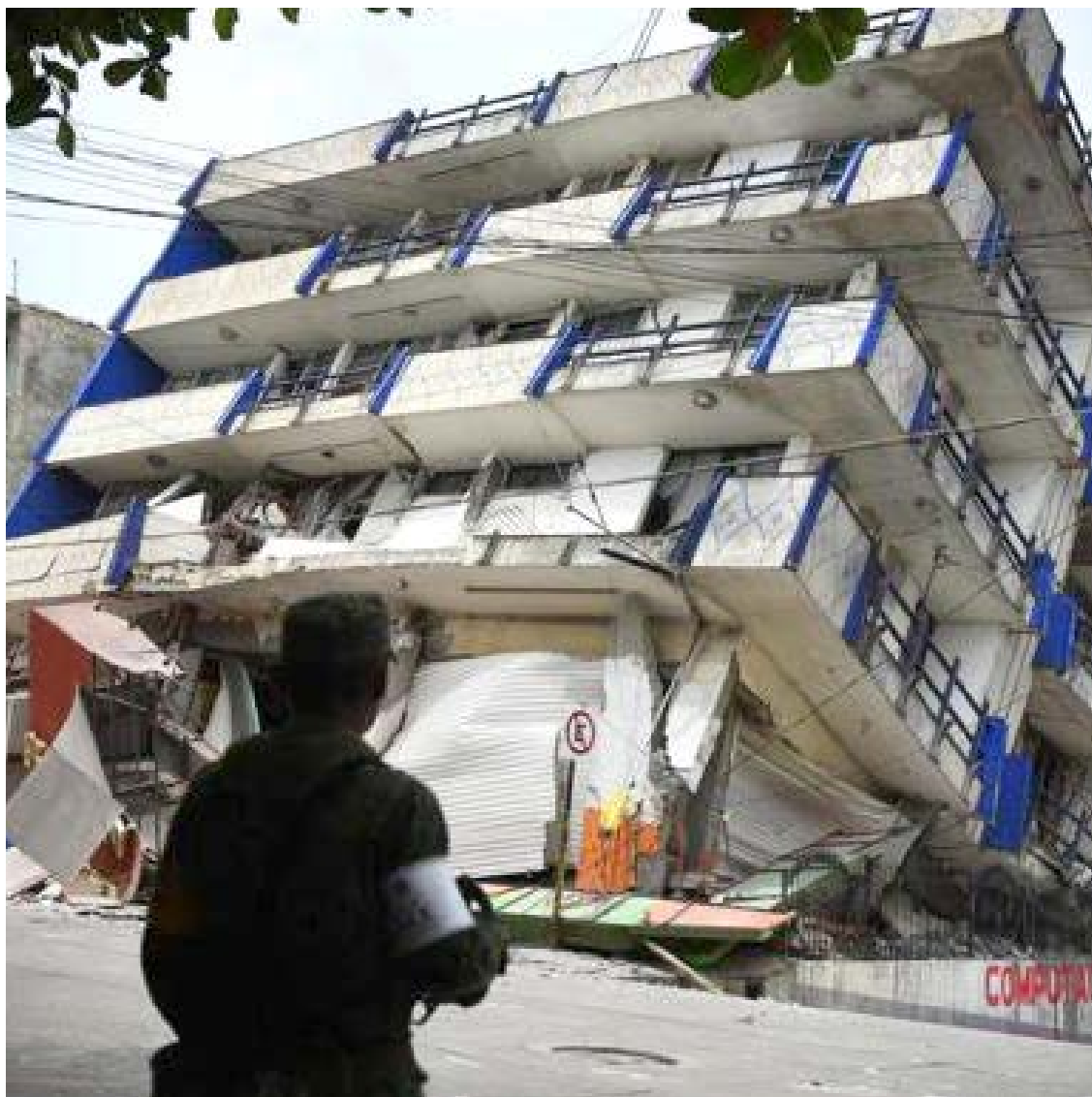
Hotel afetado por terremoto no estado de Oaxaca, no México

Até agora, as autoridades registraram 230 mortes por causa do terremoto de magnitude 7,1, das quais 100 na Cidade do México, 69 no estado de Morelos, 43 em Puebla, 13 no Estado do México, 4 em Guerrero e 1 em Oaxaca.