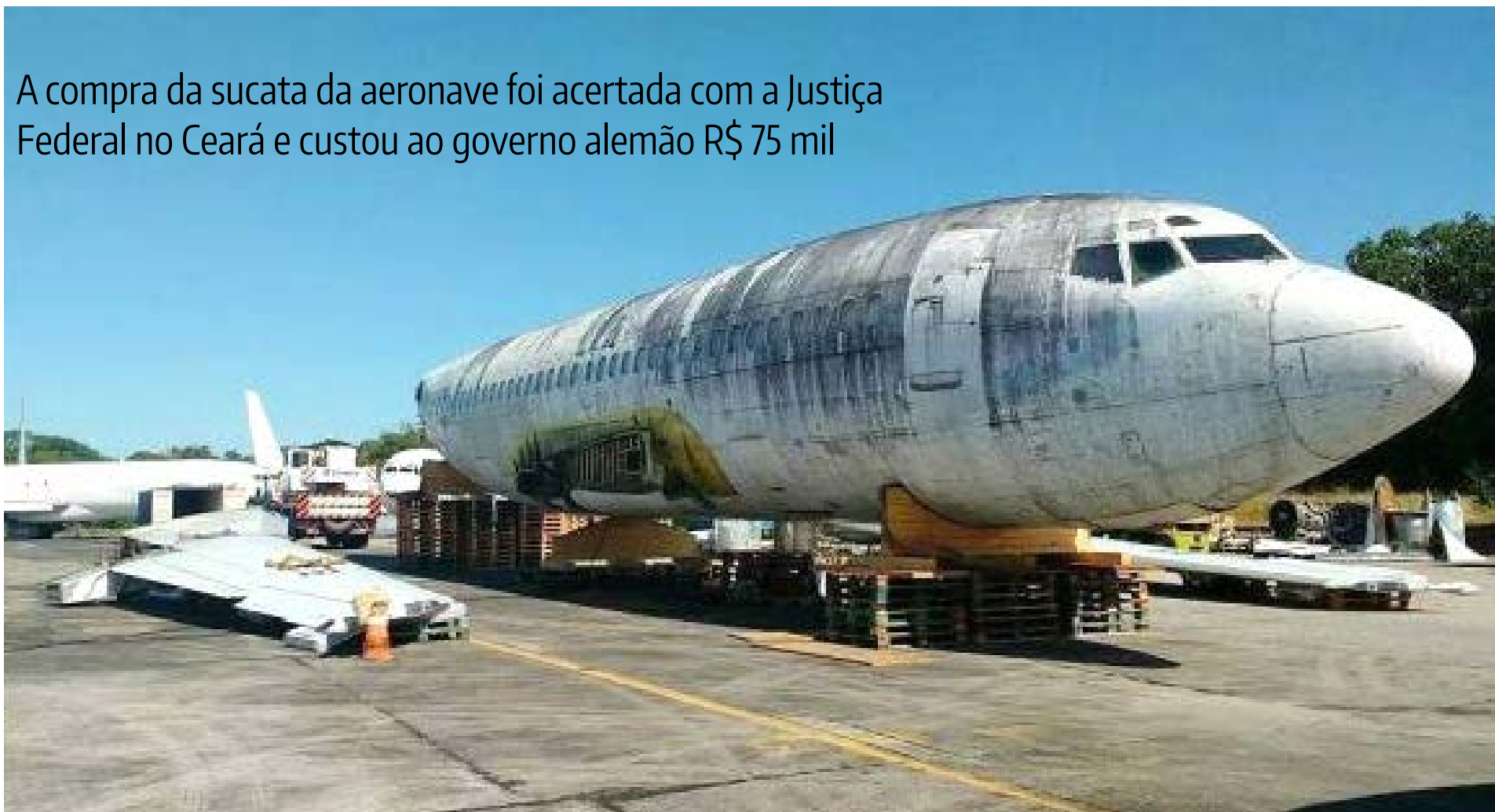
A sucata do Boeing 737-200 está abandonada no terminal há quase uma década e agora será transportada para a Alemanha

A compra da sucata da aeronave foi acertada com a Justiça Federal no Ceará e custou ao governo alemão R$ 75 mil