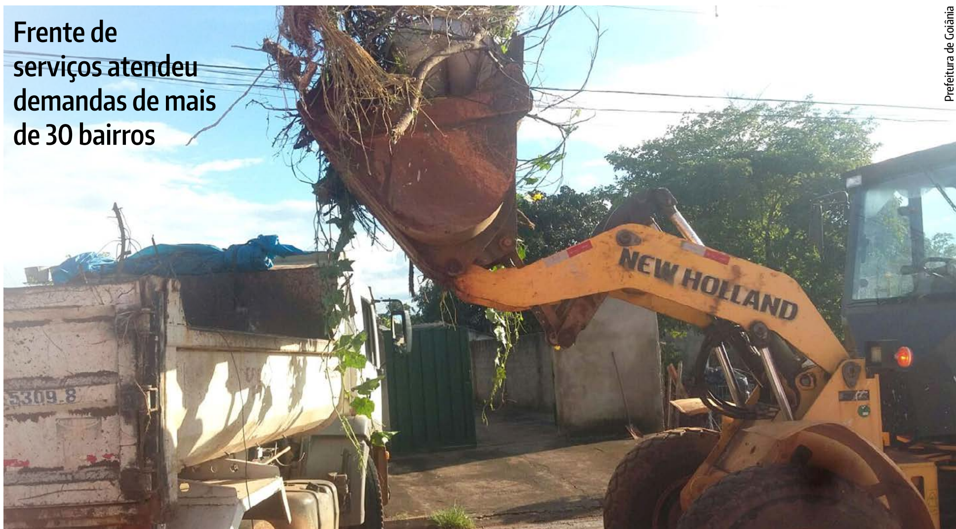
Prefeitura de Goiânia

Frente de serviços atendeu demandas de mais de 30 bairros