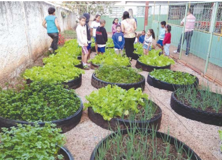
Prefeitura de Goiânia

Em hortas convencionais ou pneus, as instituições plantam e utilizam legumes e hortaliças na merenda. Os mais comuns são couve, cebolinha, coentro, alface, acelga, pimenta, pimenta-de-cheiro, entre outros alimentos e temperos.