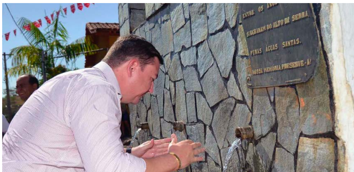
Governador em exercício, José Vitti, no novo sistema de água

Uma Estação de Tratamento de Água (ETA) que integra o complexo do Sistema Produtor Mauro Borges, entrou em funcionamento no dia último dia 9, com a finalidade de complementar a produção de água tratada para Goiânia e região metropolitana. Quarenta e um bairros, que antes eram atendidos pelo Sistema Meia Ponte, hoje já recebem um aporte na oferta de água que corresponde a 1000 litros por segundo, advindos da nova Estação. A ação antecipada, que ocorreu em caráter de emergência, teve como objetivo minimizar os problemas decorrentes do déficit no