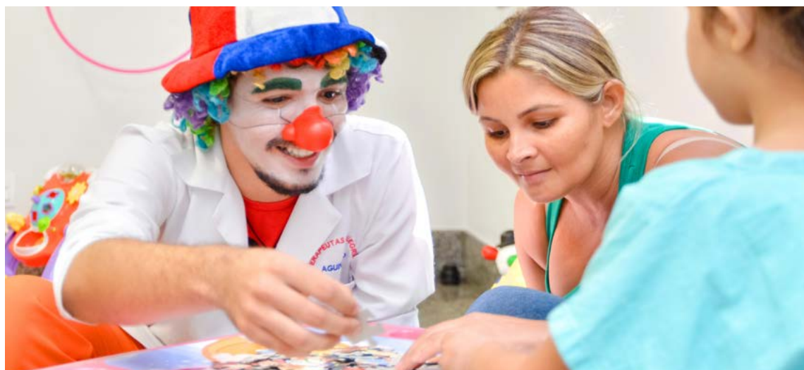
Governo de Goiás

“A prevenção é importante, pois as crianças podem ficar com se-