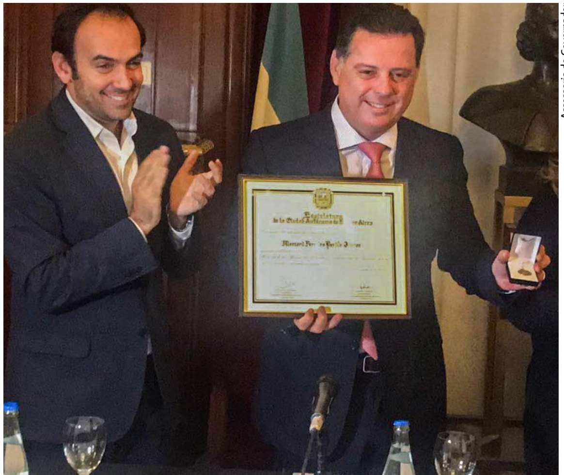
Assessoria do Governador

"Goiânia, a capital do meu estado, a Grande Goiânia, no caso, com os mesmos 3 milhões de habitantes de Buenos Aires, também é cercada de verde, de convivência e de afeto mas, especialmente, o que mais temos em comum são as portas abertas", completou Marconi.