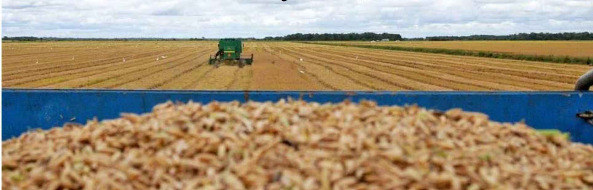
Kleiber Arantes / Secom

O ano deve ser encerrado com uma safra de grãos de 240,9 milhões de toneladas