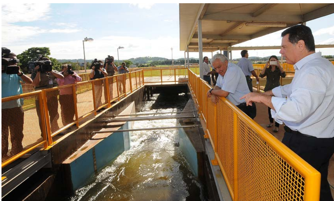
Sistema Mauro Borges entrou em pré-operação em dezembro de 2016

a segunda quinzena de setembro. Neste período de estiagem, o risco de falta d'água está presente no Sistema Meia Ponte, cujo nível do reservatório baixou consideravelmente. A Saneago realiza trabalho de conscientização com produtores rurais que utilizam a água do leito do rio para atividades de irrigação, por exemplo, para que façam o uso racional e comedido do recurso natural.