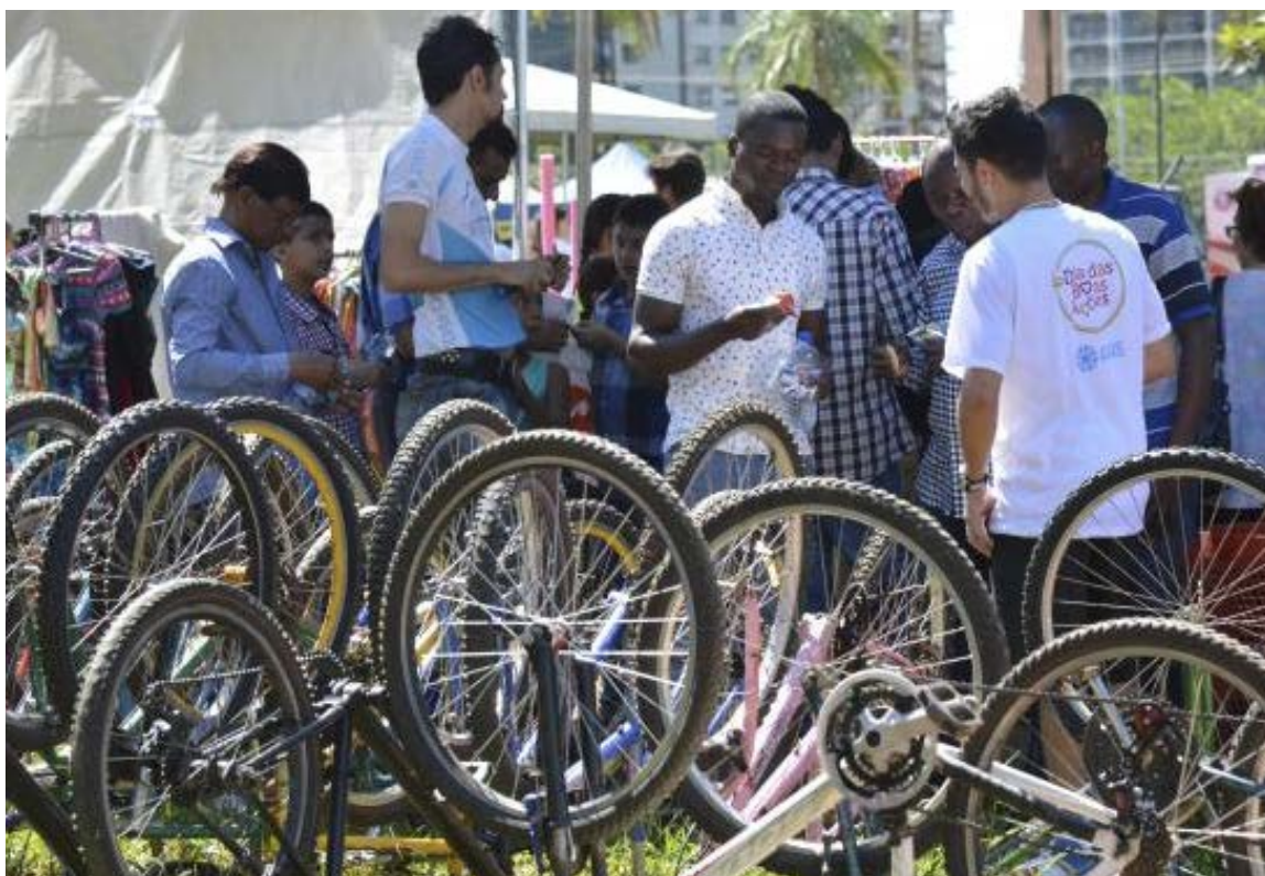
Brasília (foto) e São Paulo também fazem parte do programa de mobilidade de baixo carbono

Um dos critérios usados para escolher as avenidas que receberão a ciclovia-modelo foi a possibilidade de integração com outras ciclovias e ciclofaixas existentes na região. Segundo o coordenador de Gerenciamento de Programas e Projetos da Secretaria da Infraestrutura de Fortaleza, os 7 quilômetros do projeto-piloto vão se somar a cerca de 20 quilômetros da estrutura para trânsito de bicicletas já existente, integrando, inclusive, o trecho da orla da Avenida Vila do Mar, no