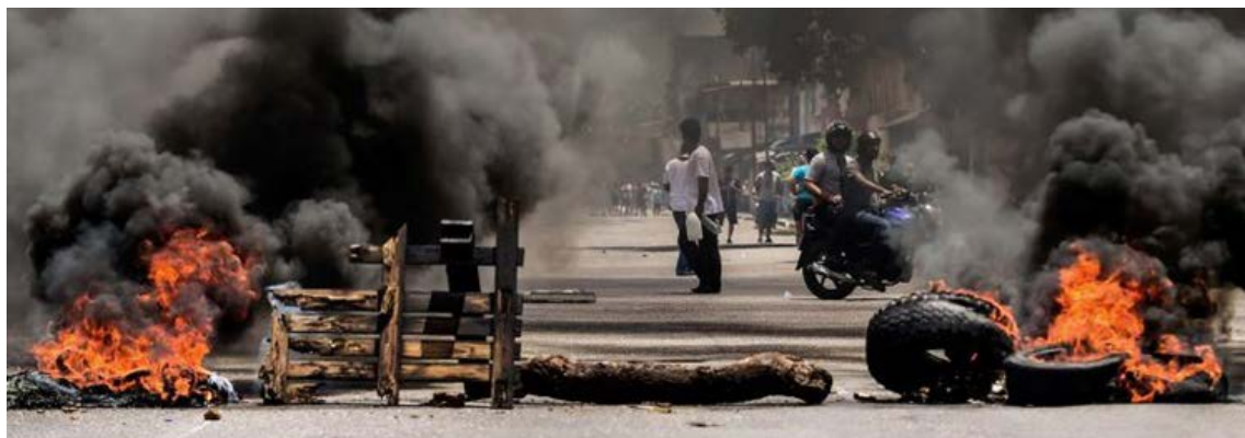
Os confrontos entre as forças de segurança e os manifestantes antigovernamentais deixaram 125 mortos entre abril e julho

“A minha investigação sugere a possibilidade de que possam ter sido cometidos crimes contra a humanidade, algo que só pode ser confirmado por uma investigação penal posterior”, apontou o diplomata jordaniano em seu discurso de abertura da 36ª sessão do Conselho de Direitos Humanos (CDH). Zeid disse que apoia o conceito de uma Comissão Nacional da Verdade e Reconciliação, mas considerou