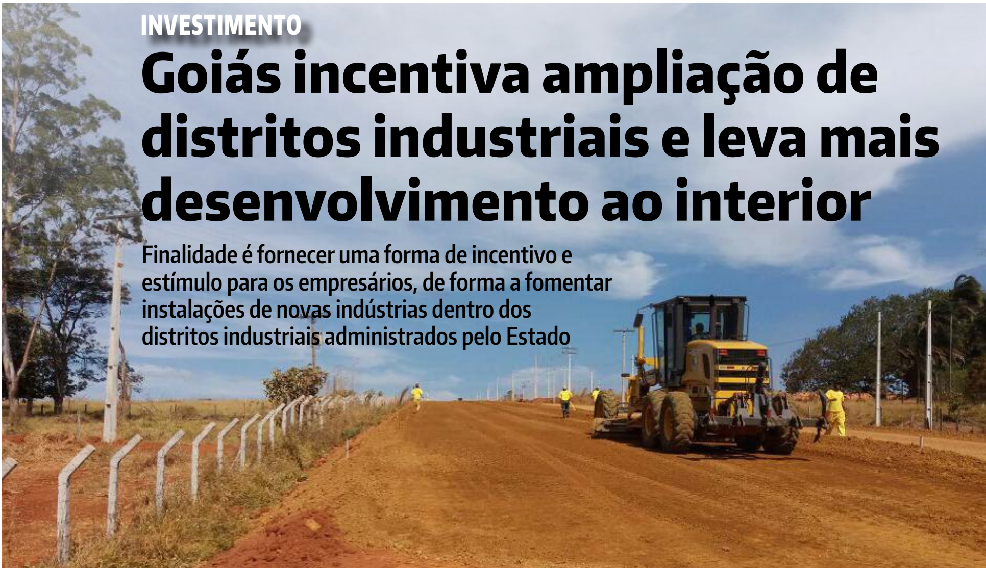
Obras de construção do anel viário do Daia, em Anápolis

Finalidade é fornecer uma forma de incentivo e estímulo para os empresários, de forma a fomentar instalações de novas indústrias dentro dos distritos industriais administrados pelo Estado