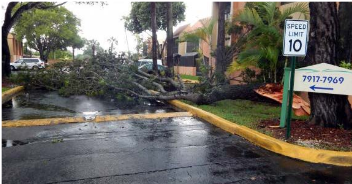
Árvore caída na pista devido aos fortes ventos das primeiras chuvas ligadas ao Furacão Irma em Miami

Em um aviso publicado no Twitter na última segunda-feira (11), as autoridades do aeroporto explicaram que não estão previstos para hoje voos comerciais e que só “algumas companhias aéreas” vão transportar por via aérea pessoal e tripulações com o fim de se preparar para o reatamento do tráfego aéreo.