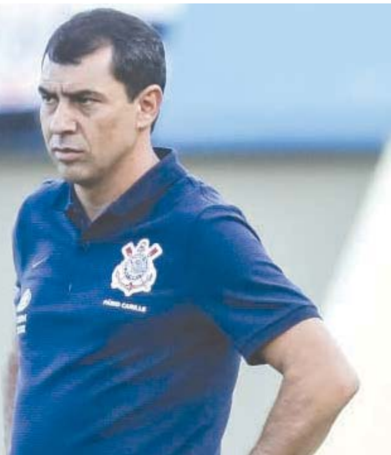
Rodrigo Gazzanel / Agência Corinthians

No Brasileiro, o líder Corinthians tem a terceira pior campanha do retorno, com três derrotas e somente uma vitória, desempenho superior somente aos de Coritiba e Sport