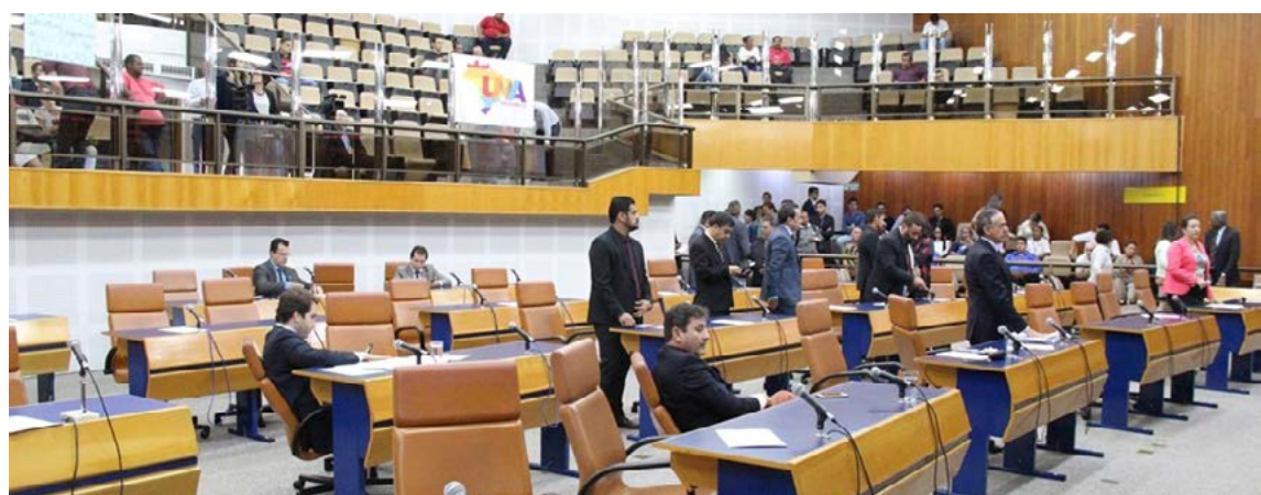
Câmara de Goiânia

A matéria, que modifica o parágrafo único do artigo 5º da Lei 9.704/20125 (Planta de Valores Imobiliários de Goiânia/2016), foi apresentada em fevereiro deste ano e teve a assinatura de