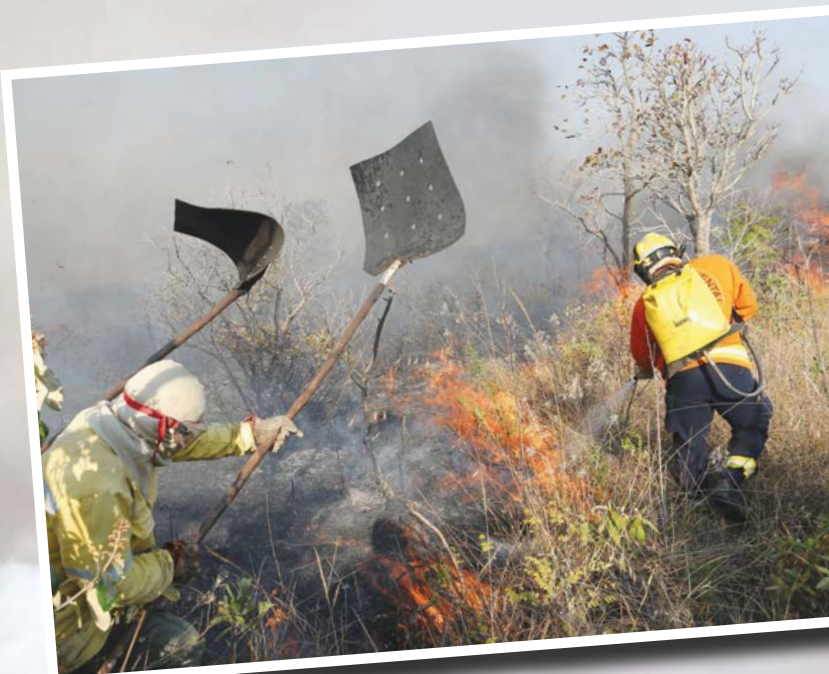
Incêndio no Parque Nacional de Brasília começou na quarta-feira