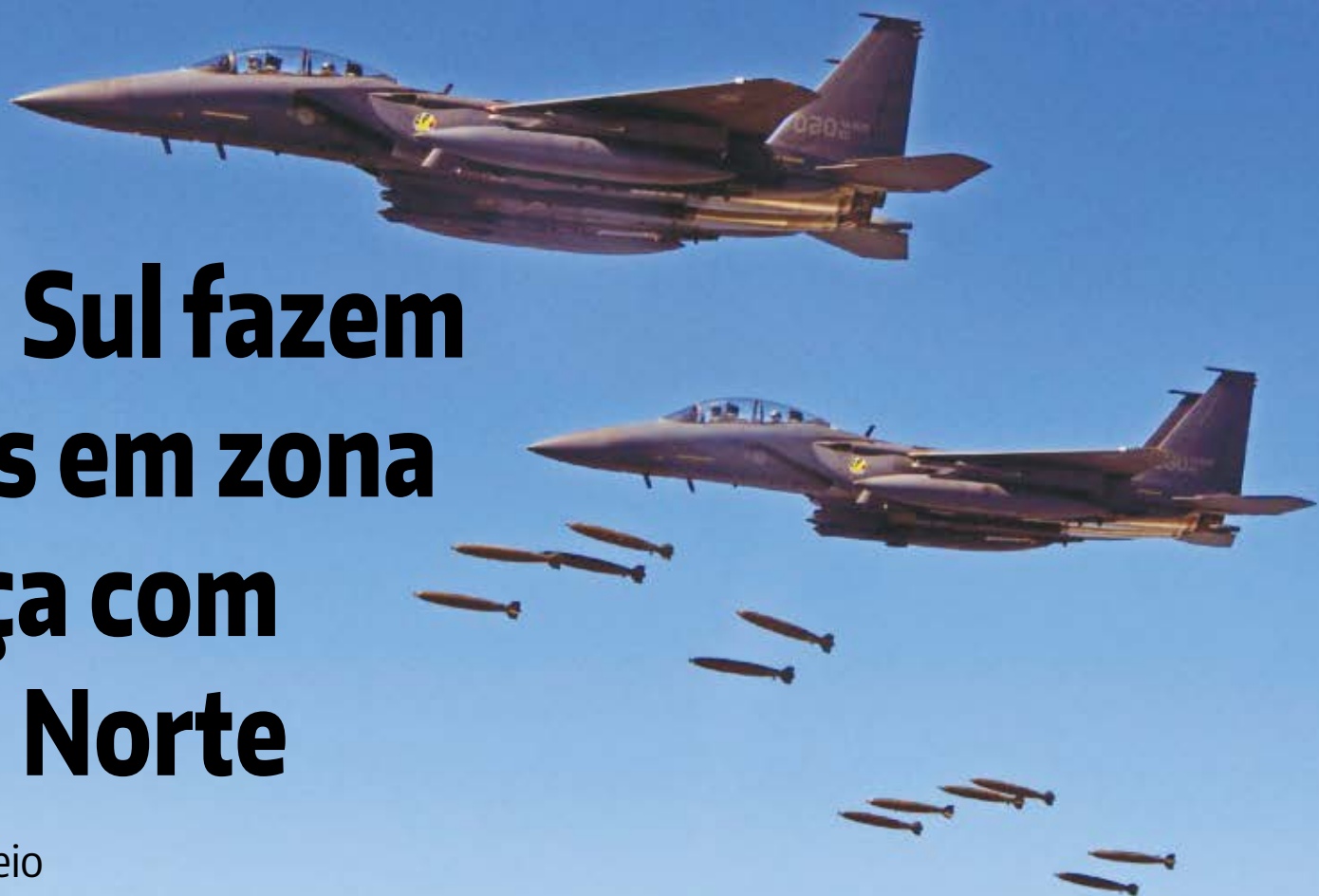
Força aérea da Coreia do Sul lança bombas durante exercício militar em conjunto com os EUA

Simulação de bombardeio é uma forma de exibição de força após lançamento de um míssil norte-coreano