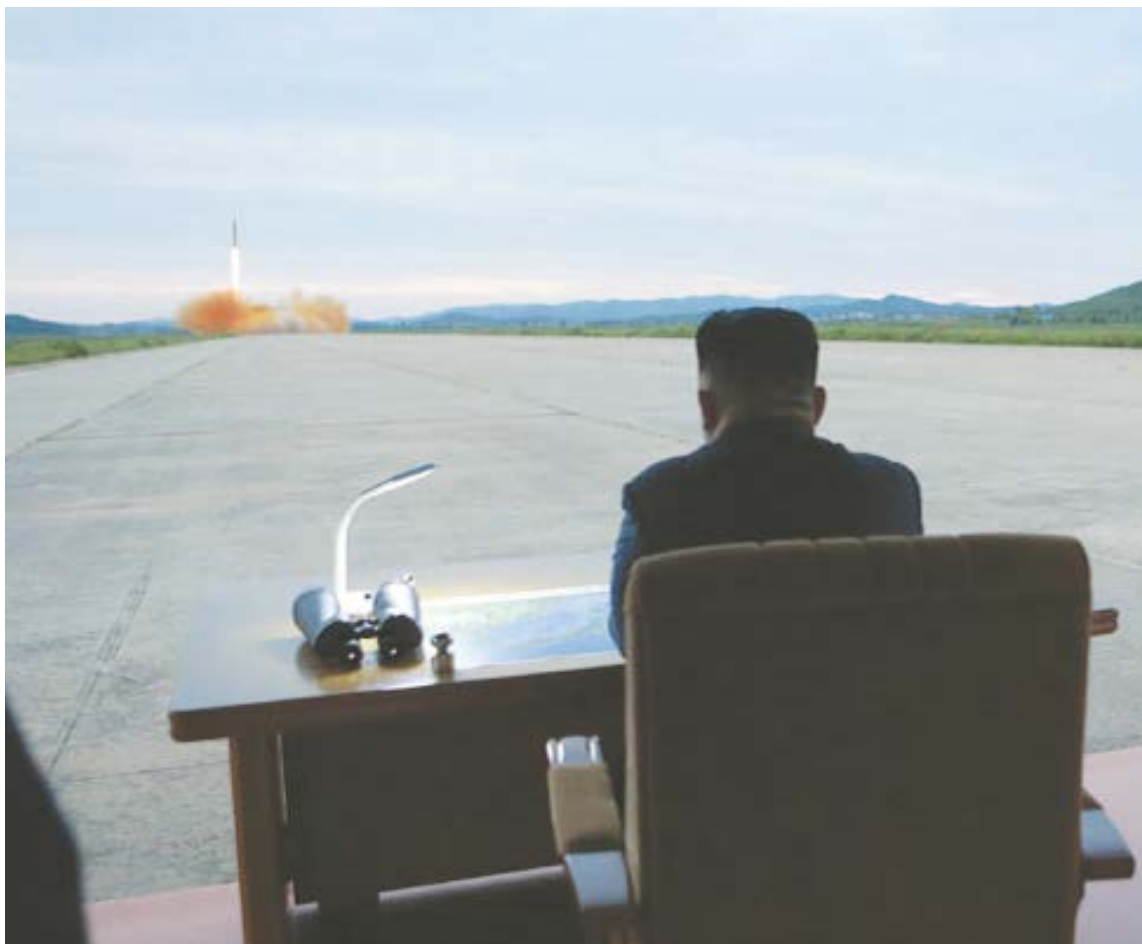
Kin Jong Un acompanha o lançamento do foguete estratégico e médio alcance balístico do EPC

A reação na península coreana foi imediata. Após o lançamento, a Coreia do Sul divulgou imagens de testes de mísseis que também estaria produzindo e fez exercí-