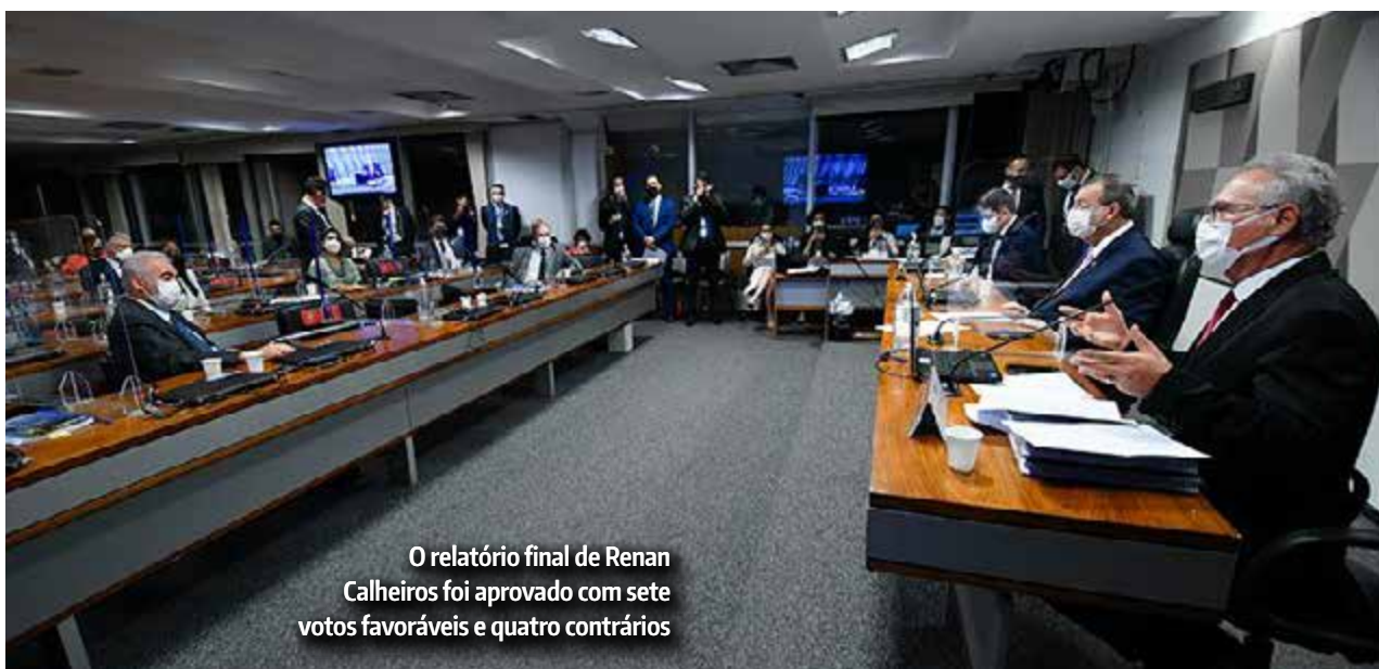
O relatório final de Renan Calheiros foi aprovado com sete votos favoráveis e quatro contrários

Além deles, Renan Calheiros identificou infrações penais cometidas por duas empresas, a Precisa Medicamentos e a VTCLLog, e por outras 74 pessoas. Entre elas, deputados, empresários, jornalistas, médicos, servidores públicos, ministros e ex-ministros de Estado.