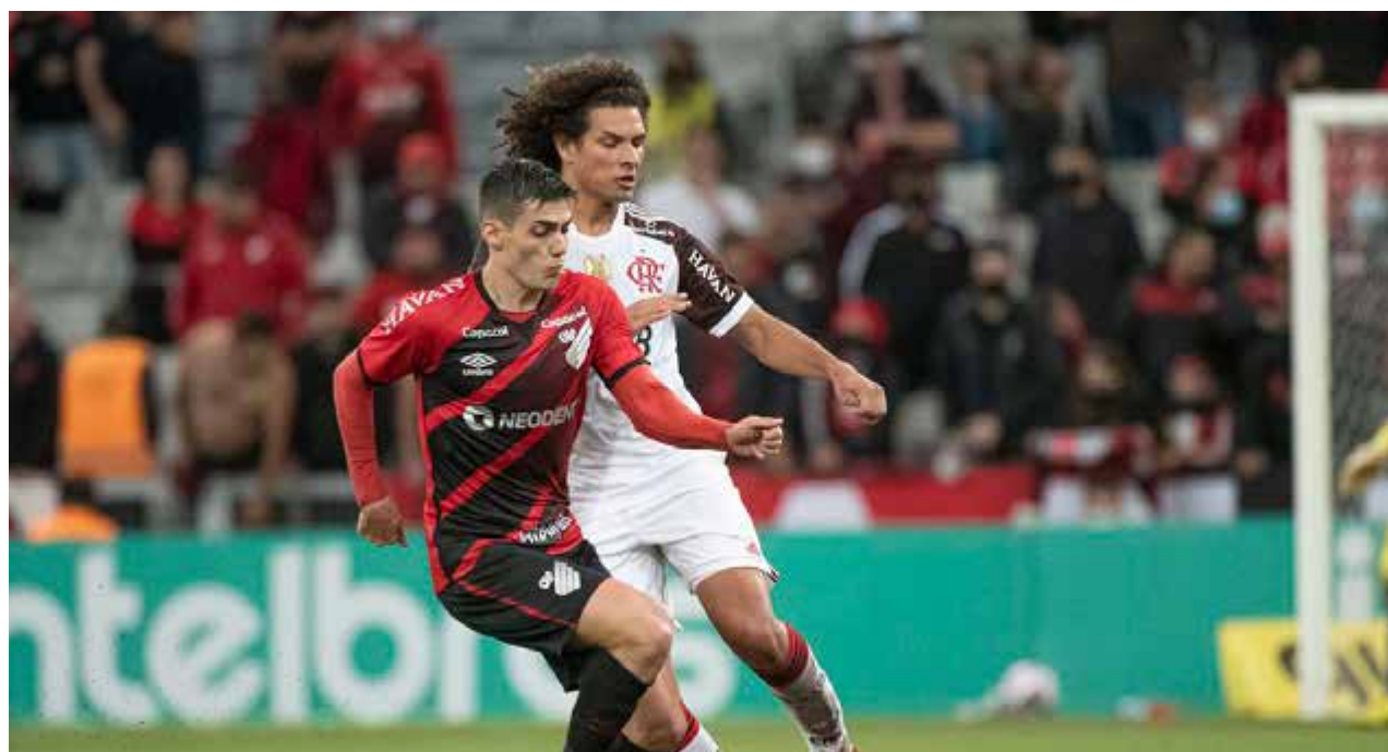
Flamengo e Athletico-PR terá transmissão, ao vivo, da Rádio Nacional, com narração de André Luiz Mendes, comentários de Waldir Luiz

O Rubro-Negro chega após perder de 3 a 1 para o Fluminense no Campeonato Brasileiro (após este resultado a equipe da Gávea caiu para a 4ª posição na competição nacional e viu o líder Atlético-MG ampliar