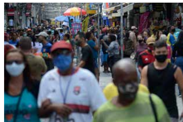
Segundo a pesquisa, a população desocupada caiu 7,7%

A taxa de subutilização caiu 1,9 ponto percentual, no trimestre, e 3,2 pontos percentuais, na comparação anual, ficando em 27,4%. São 31,1 milhões de pessoas subutilizadas, o que representa queda