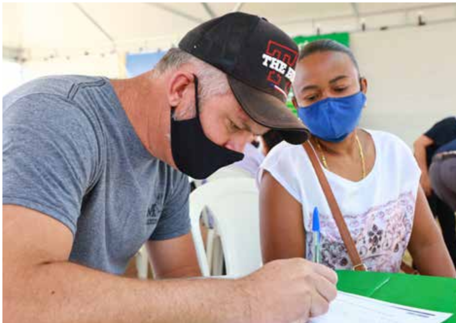
Beneficiário do Morada Nova recebe escritura em entrega em setembro, em Anápolis

A previsão de término da etapa de cadastramento é para 15 de novembro, mas a data pode variar conforme as condições do clima, que influenciam na capacidade de deslocamento e atendimentos das equipes. Os cadastradores