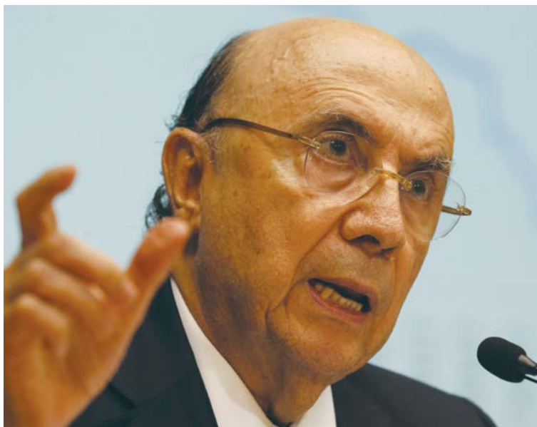
Segundo o ministro da Fazenda Henrique Meirelles, as privatizações anunciadas pelo governo federal ajudarão no cumprimento da meta fiscal do país