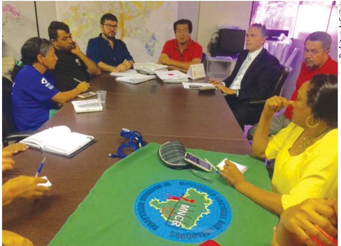
Prefeitura de Goiânia

Conforme Gasel, o auxílio às cooperativas contempla pontos que são estabelecidos na Política Nacional de Resíduos Sólidos (PNRS), que prevê a prevenção e a redução na geração de resíduos, tendo como