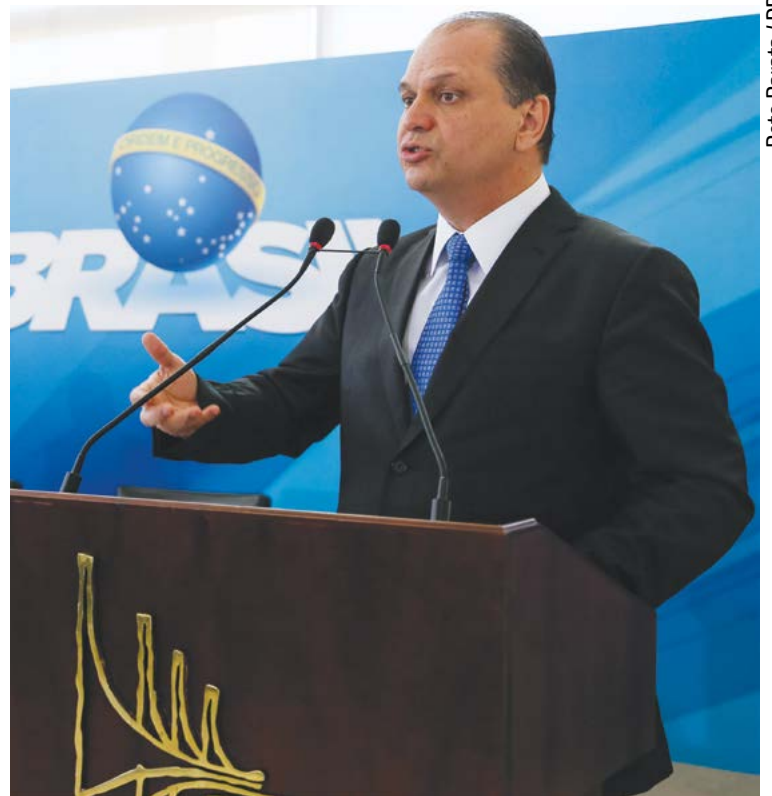
Beto Barata / PR

“Assim que receber a notificação, [o ministério da Saúde] apresentará ao órgão os 878 processos reunidos pelo Conselho Nacional de Secretários Municipais de Saúde (Conasems) referentes a ações do Ministério Público contra gestores municipais que apontam irregularidades de cumprimento de carga horária de profissionais de saúde, inclusive médicos. Ainda, informará sobre os mais de 100 profissionais médicos que estão sendo processados na Justiça, por outros autores, pelo não cumprimento de carga horária nas unidades básicas de saúde”, disse o órgão, na nota.