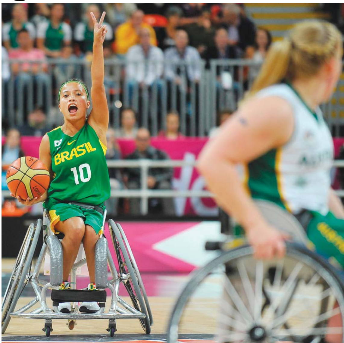
Bruno de Lima / CPB

A jovem foi escolhida entre quinze concorrentes como miss por um time de 13 jurados entre médicos, psicólogos e fisioterapeutas. Em novembro, representará o Distrito Federal na etapa nacional do concurso. “A limitação do movimento não pode ser a limitação da vida.”