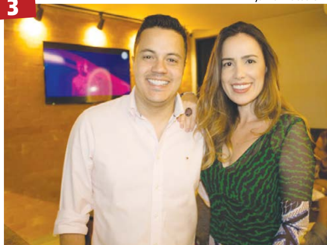
Junior Fotos OFC