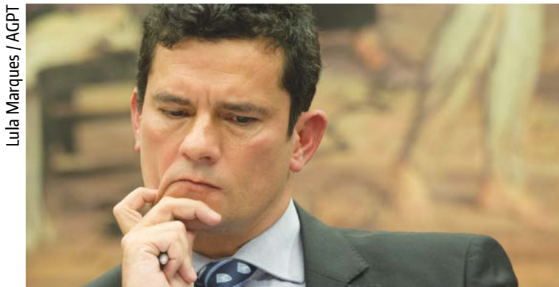
Sérgio Moro impediu uso de telefone celular por “experiência negativa anterior”, quando advogado filmou audiência.

O Tribunal Regional Federal da 4ª Região (TRF4) negou provimento a um mandado de segurança que pedia a liberação do uso de aparelhos celulares em audiências da Operação Lava Jato. Segundo a decisão, cabe ao juiz definir as medidas a serem tomadas para o bom andamento da audiência.