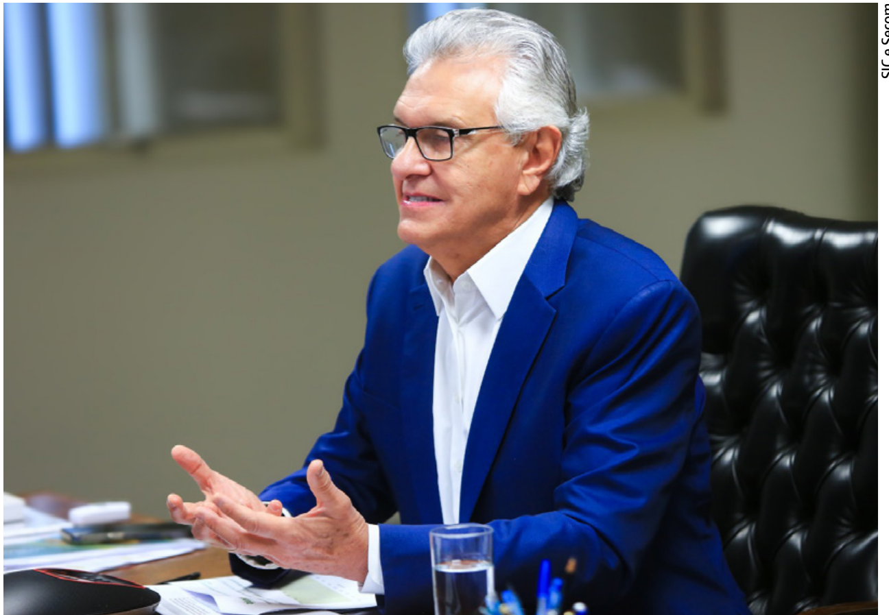
SIC e Secom

Em relação aos salários e outras remunerações pagas por empresas comerciais, foram contabilizados R$ 9,8 bilhões para 348,1 mil pessoas ocupadas. Desse modo, obteve-se uma média salarial de