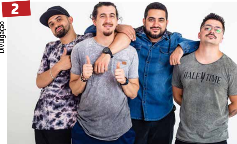
Stand up - De volta a Goiás o fenômeno do humor na web que vem lotando várias sessões em diversos teatros do Brasil, Os 4 Amigos. No domingo, dia 10 de novembro, Goiânia recebe o stand-up no teatro Rio Vermelho, em única sessão, às 20h. Já em Anápolis os amigos desembarcam na quinta-feira, dia 21 de novembro, no teatro São Francisco em uma sessão às 19h.