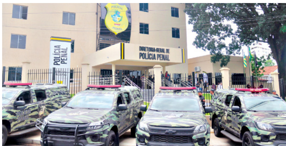
Mais de 50,7 mil candidatos disputam 1,6 mil vagas, neste domingo, no concurso da Polícia Penal de Goiás

A seleção será dividida em sete fases: pro-