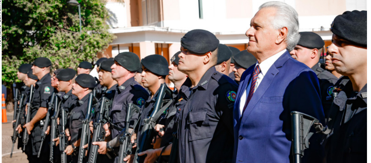
Governador Ronaldo Caiado recebe os integrantes da 21ª turma do COR e a cúpula da segurança pública de Goiás

a aplicação, no campo, do conhecimento adquirido durante o treinamento. “São equipes que vão trabalhar no confronto direto, e também fazer patrulhamento e recobrimento de área onde houver a necessidade”, detalhou o secretário de Segurança Pública, Renato Brum, sobre a amplitude do trabalho da Rotam.