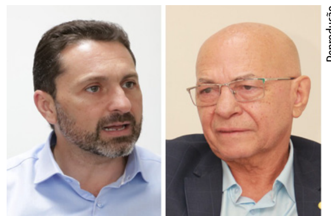
Na estimulada, Vilela está com 33% e Alcides, que aparece com 42,2%

Além de medir as intenções de voto, o levantamento também avaliou a rejeição dos candidatos, oferecendo um panorama completo das percepções