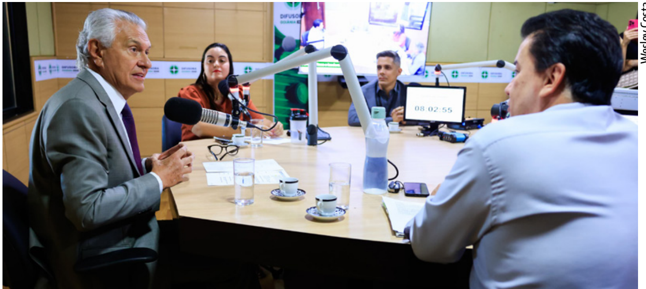
Governador Ronaldo Caiado concede entrevista à Rádio Difusora: "O Estado não pode tudo, mas dentro do possível estamos fazendo um trabalho exemplar"

Caiado também lembrou que Goiás foi o estado que mais reduziu o desmatamento no Cerrado no último ano e citou medidas de médio e longo prazos para incentivar a preservação do bioma, em parceria com o setor produtivo. Uma delas é o Programa Estadual de Pagamento por Serviços Ambientais (PSA), lançado na última terça-feira (10/9). Conhecida como Cerrado