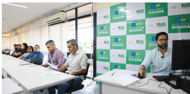
Entre janeiro e agosto, Nota Fiscal Goiana distribuiu R$ 1,6 milhão entre consumidores inscritos

Em quarto e quinto lugar, Rio Verde (42) e Trindade (29) também se destacam na lista de municípios com moradores mais sortudos. Catalão, Luziânia e Valparaíso