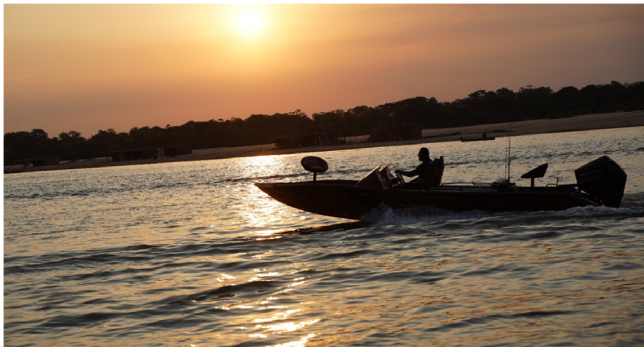
Volume de serviços de turismo em Goiás cresceu 5,8% em julho de 2024, na comparação com o mesmo período de 2023

N a comparação com julho de 2023, o volume de serviços de turismo em Goiás cresceu 5,8%, depois de um aumento de 3,9% em junho. Em julho de 2024, as atividades turísticas em Goiás também subiram 3,9% em relação ao mês anterior, após uma alta de 0,5%, na série com ajuste sazonal, conforme dados da Pesquisa Mensal de Serviços (PMS), divulgada nesta quarta-feira (11/9), pelo Instituto Brasileiro de Geografia e Estatística (IBGE). “O crescimento das atividades turísticas em julho destaca o potencial