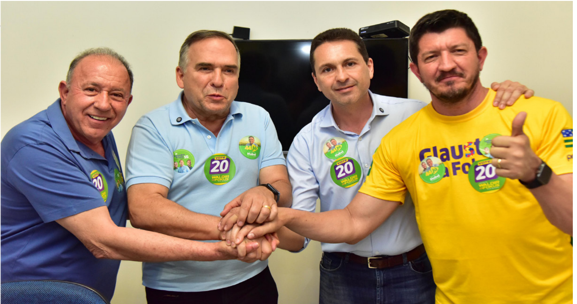
Candidatos a prefeito buscam estabelecer um novo eixo de desenvolvimento econômico entre as três cidades, beneficiando a população