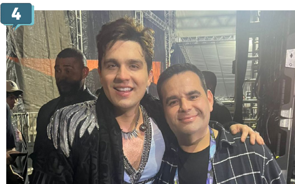
Luan Santana e Eduardo Maluf