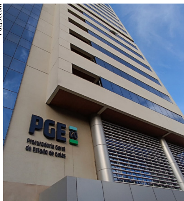
Vagas em órgãos do Governo de Goiás têm carga horária de 40 horas semanais e salários que variam de R$4,8mil a R$8,3mil

Os editais das seleções simplificadas foram publicados na edição de segunda-feira (3/9) do Diário Oficial do Estado ( diariooficial.abc.go.gov.br/porta/