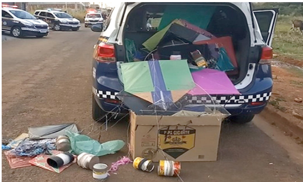
Material apreendido durante a campanha Pipa Sem Cerol, que busca conscientizar crianças, adolescentes e adultos sobre os perigos do uso do produto

O material educativo foi idealizado e produzido pelo grupo Anjos da Guarda, da GCM, que tem se dedicado à prevenção primária através de atividades lúdicas com crianças da Rede Municipal de Educação. O gibi educativo aborda, de forma divertida