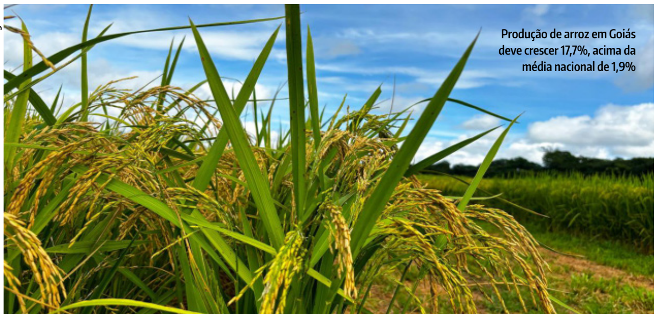
Produção de arroz em Goiás deve crescer 17,7%, acima da média nacional de 1,9%