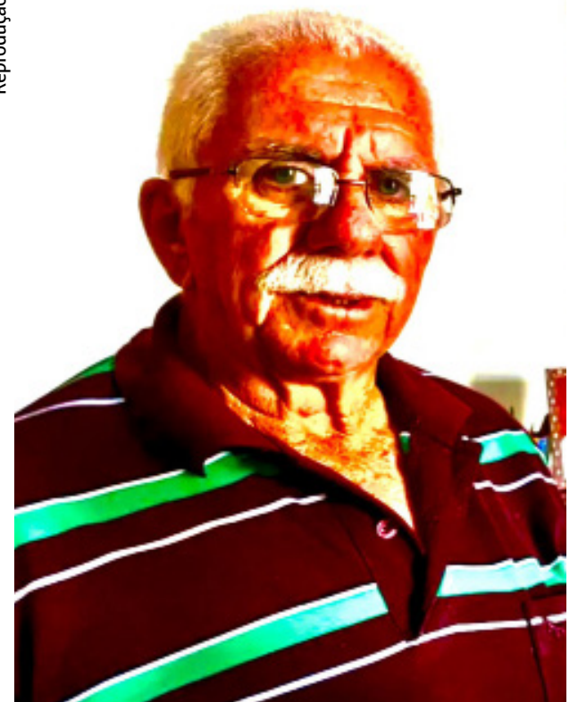
Prefeito de Nazário, João Batista Carvalho (Ferruja)