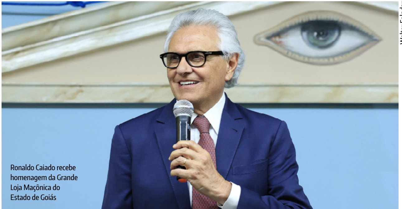
Ronaldo Caiado recebe homenagem da Grande Loja Maçônica do Estado de Goiás