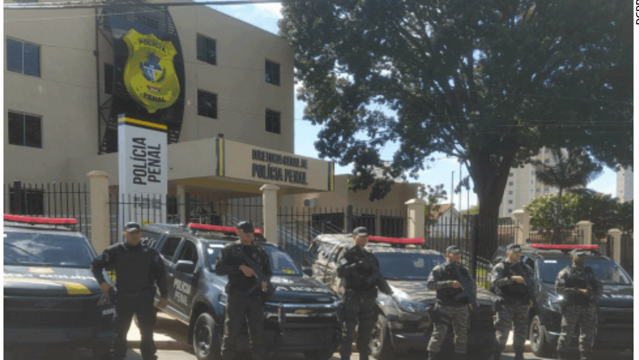
Polícia Penal de Goiás terá incremento de 1,6 mil servidores após a realização de concurso público

A seleção é dividida em sete fases: prova objetiva, prova discursiva, avaliação médica, avaliação de aptidão física, avaliação psicológica, avaliação de vida progressa e investigação social e avaliação de títulos. Candidatos com deficiência também passarão por avaliação de equipe multiprofissional. A data provável da aplicação das provas