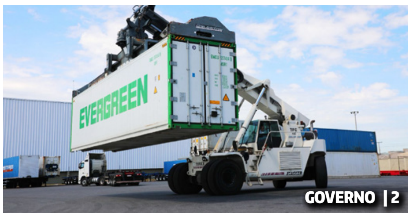
GOVERNO | 2

GOIÁS ALCANÇA MELHOR ÍNDICE DE ATIVIDADE ECONÔMICA DO PAÍS, APONTA BANCO CENTRAL