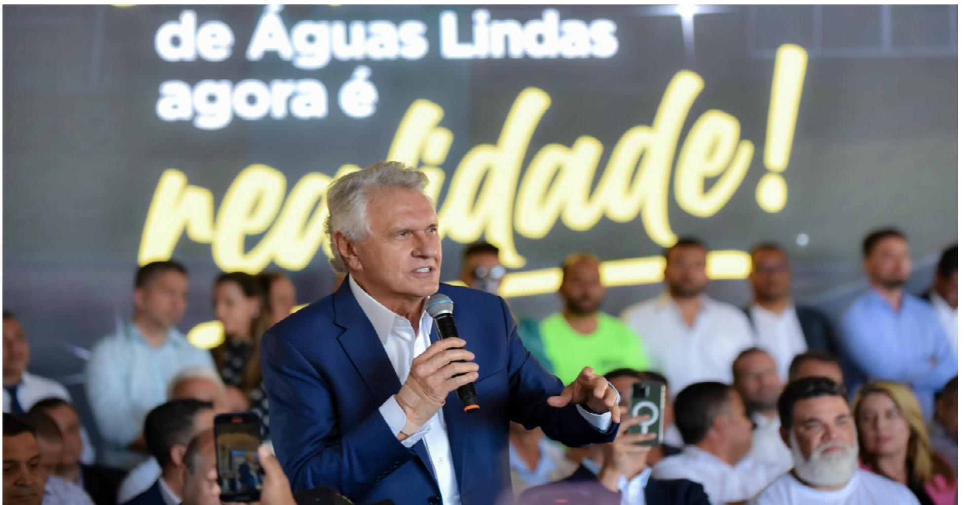
Governo de Goiás dá fim à espera de 20 anos e inaugura unidade de média e alta complexidade com 164 leitos, sendo 40 UTIs, no Entorno do DF