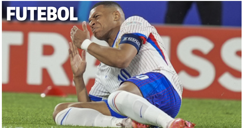
FUTEBOL Mbappé brinca sobre máscara após fratura no nariz em jogo ESPORTE | 6