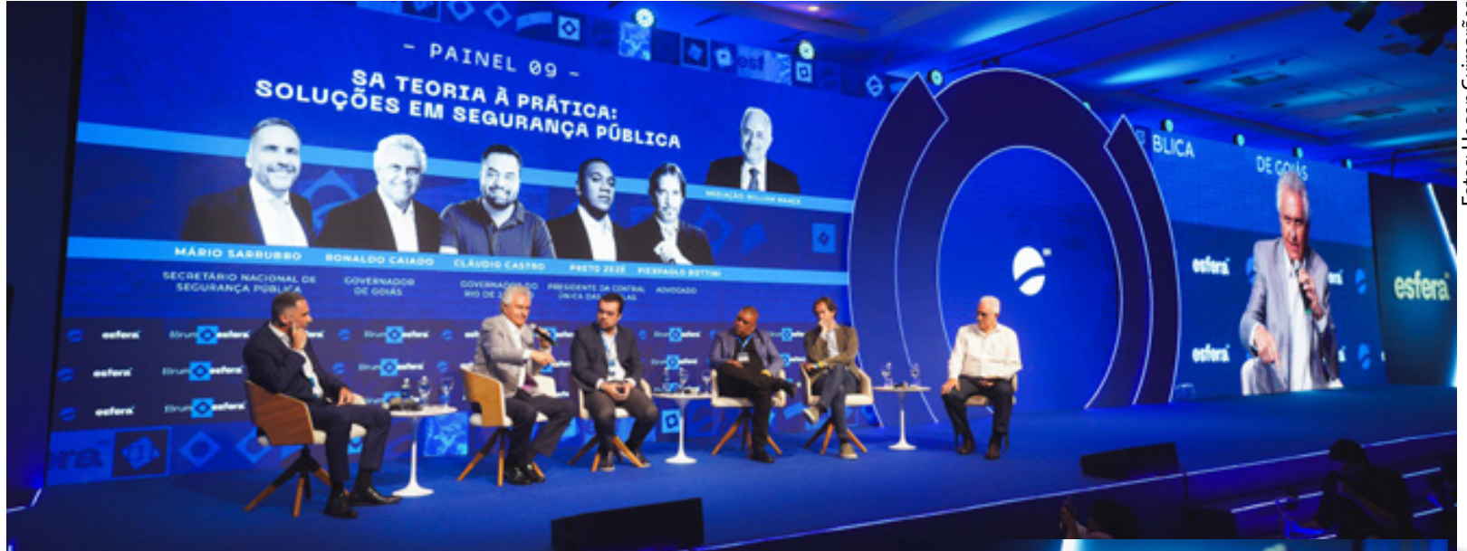
Caiado fala sobre sucesso no combate ao crime em Goiás, em fórum nacional no Guarujá em São Paulo

pautas dos participantes foi a necessidade nacional de combate aos grupos e facções criminosas e o tráfico de drogas. Em meio às discussões, Caiado ressaltou que é preciso coragem para tomar medidas duras, como, por exemplo, o isolamento de líderes dentro dos presídios e a proibição de visitas íntimas. “No meu estado não tem visita íntima para estuprador ou faccionado”, relatou o governador.