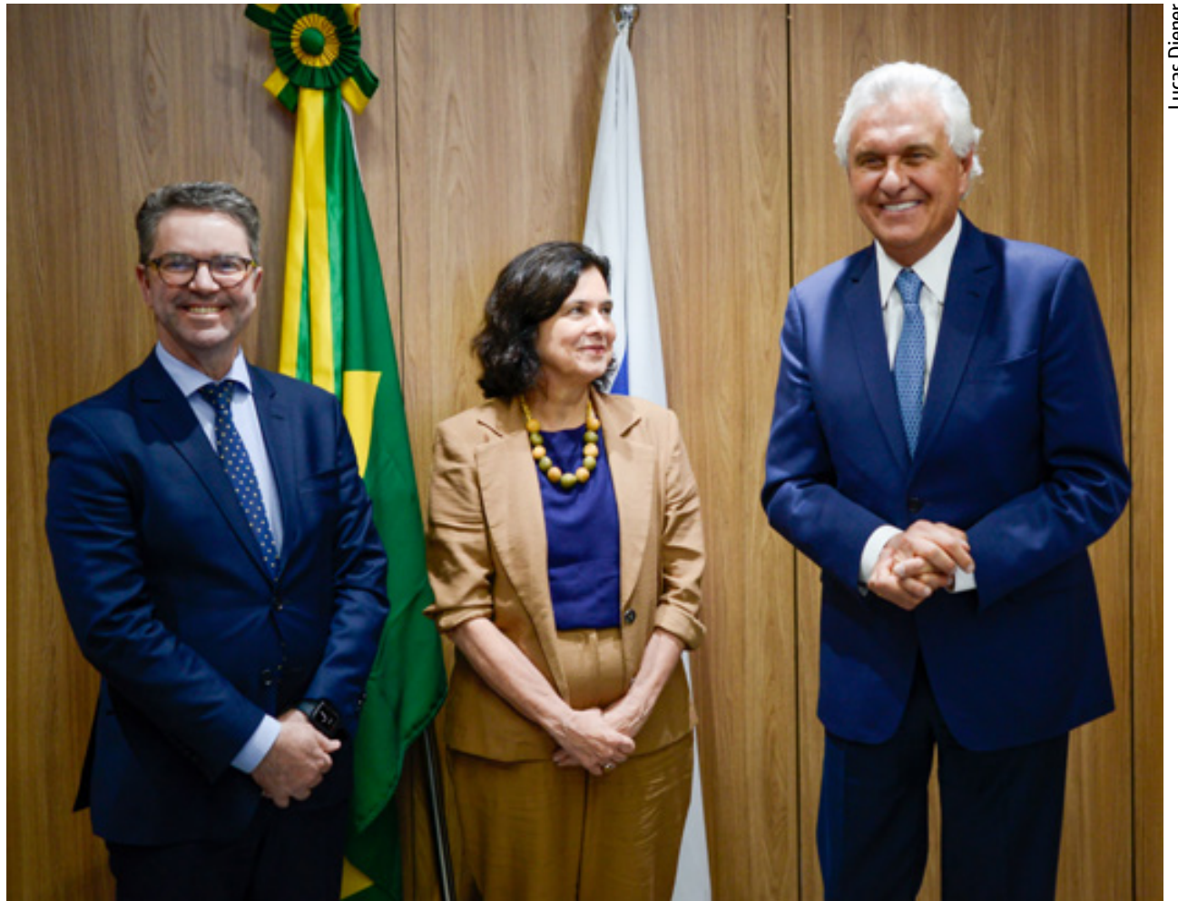
Governador Ronaldo Caiado se reúne com a ministra Nísia Trindade para tratar de repasse de recursos para a saúde, em Goiás

Com mais de 15 mil m 2 de área construída, a estrutura contará com 164 leitos, incluindo uma maternidade, e destinará 20 leitos de terapia intensiva para bebês e crianças. “Conseguimos com a ministra a agilidade para o custeio do Hospital de Águas Lindas. A unidade de saúde