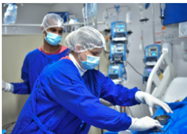
Houve redução de 66,73% da fila por cirurgias eletivas em Goiás

No Hospital Estadual de Trindade Walda Ferreira dos Santos (Hetrin) já foram iniciados os procedimentos de preparação dos 330 pacientes que passarão por cirurgias no local. O mutirão também será realizado no Hospital Estadual do Centro-Norte Goiano (HCN), no Hospital Estadual de São Luís de Montes Belos Dr. Geraldo Landó (HSLMB) e no Hospital Estadual de Jataí Dr. Serafim de Carvalho (HEJ).