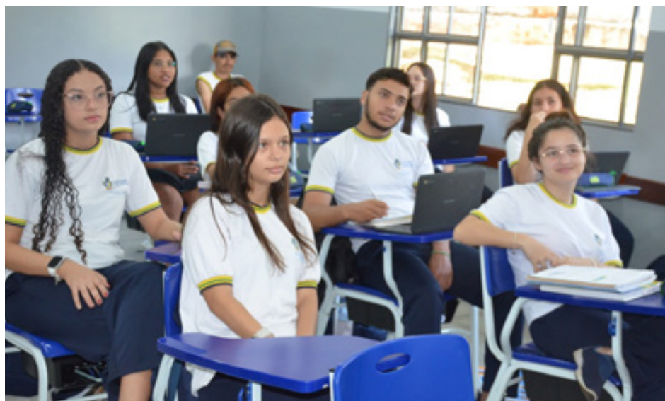
Para ninguém ficar de fora: escolas da rede estadual de ensino auxiliam estudantes a fazer inscrição no Enem 2024

Por meio da Secretaria da Educação (Seduc), o Governo de Goiás também prepara um "Dia D" de inscrições, que ocorrerá no próximo dia 4 de junho. Ainda, estão sendo realizadas maratonas de Redação e de revisão das demais áreas do conhecimento. As aulas estão incluídas no horário regu-