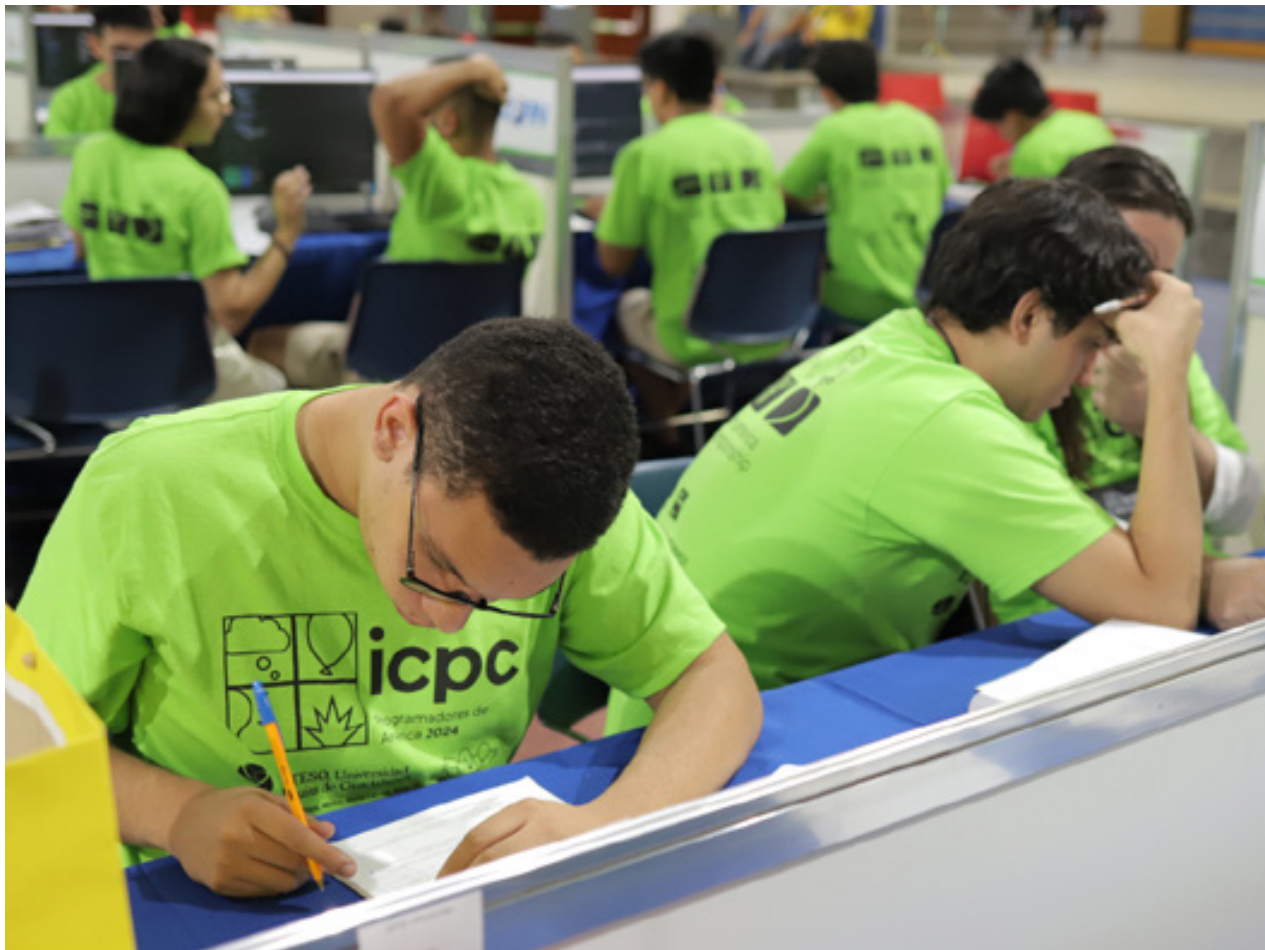
De malas prontas: equipe apoiada pelo Governo de Goiás treina para representar o estado em concurso internacional, em setembro

O concurso (International Collegiate Programming Contest, em inglês) é a competição mais prestigiada de programação algorítmica do mundo, destinada a estudantes universitários.