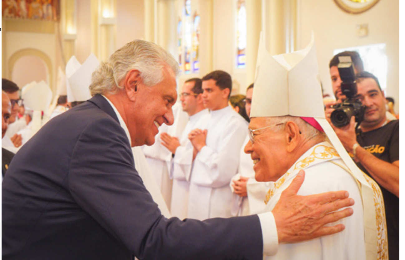
Governador Ronaldo Caiado participa da solenidade em comemoração ao dia da padroeira de Goiânia

pletou. O vice-governador Daniel Vilela também acompanhou a celebração.