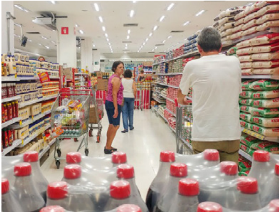
Supermercados e artigos de perfumaria foram segmentos que contribuíram para alta do comércio

Os números revelam a prioridade dada pelos consumidores à compra de