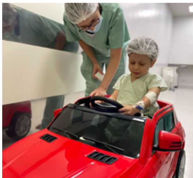
Hecad realiza em média 13 cirurgias pediátricas por dia, em processo pensado para trazer bem-estar e conforto aos pequenos

O rol de procedimentos cirúrgicos realizados pelo Hecad inclui 230