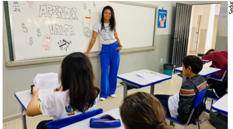
Alunos do 6º ao 9º ano podem escolher entre 10 opções de disciplinas eletivas

Alunos das turmas de 7º ano da Escola Estadual João Fagundes Furtado, de Porangatu, no interior do estado, vêm colocando em prática os conhecimentos adquiridos por meio de diversas atividades: a confecção de cofres de porquinho com material reciclável, a ela-