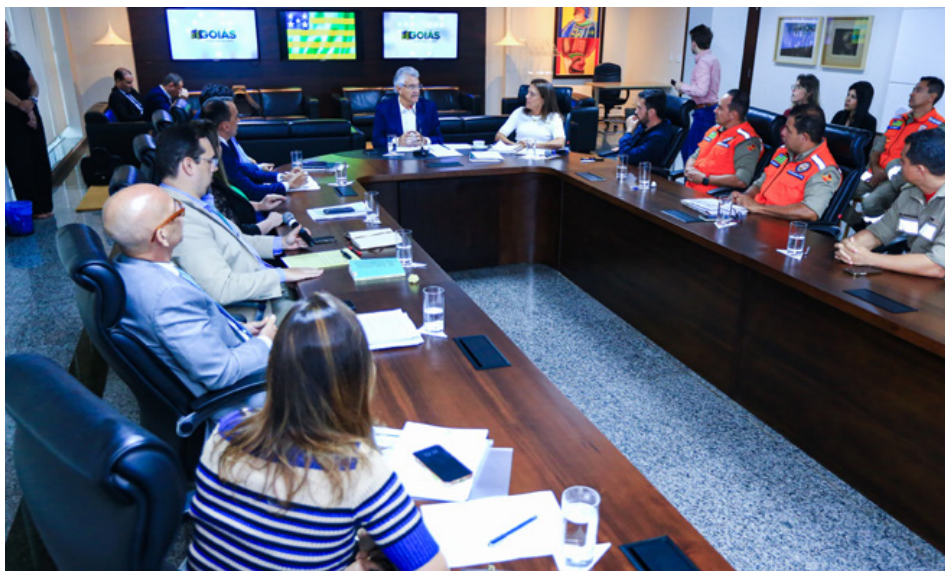
Caiado decreta situação de emergência em 25 municípios goianos por causa da falta de chuvas

O decreto leva em consideração o registro de baixos índices de chuvas, além de condições climáticas extremas por conta do período prolongado de baixa ou nenhuma quantidade de chuva, em que a perda de umidade do solo é superior à sua reposição,