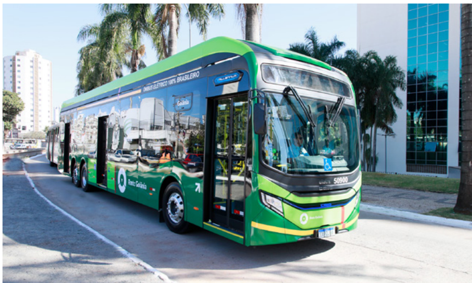
Estado investiu R$ 300 milhões no custeio do transporte coletivo desde 2020

A tarifa do transporte coletivo (sistema único, incluindo o Eixo Anhangüera) custa R$ 4,30 para o usuário. Sem o subsídio, este valor seria R$ 9,38, conforme atualização da tarifa técnica, ocorrida em janeiro. Com o novo valor, motivado pelos recentes investimentos anunciados no sistema (saiba mais abaixo), Governo de Goiás e prefeituras passarão a arcar com R$ 5,0832 de cada passagem (54,15% do valor da tarifa técnica).