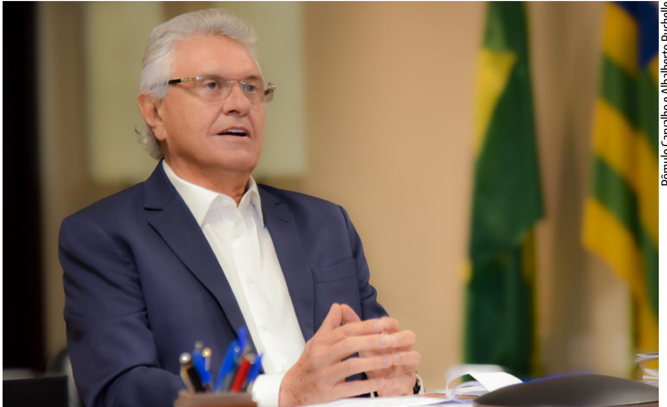
Caiado em entrevista por videoconferência: "Estado Democrático de Direito deve dar ao cidadão autonomia, direito de ir e vir e respeito"

O governador defendeu um enfrentamento corajoso das facções criminosas. "Tem governadores que não governam 25% do seu território. E com isso as pessoas sofrem. Elas deixam de acreditar no Estado, e isso abre espaço para o estado paralelo. O Estado Democrático de Direito deve dar ao cidadão au-