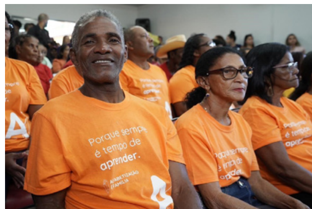
Turma da alfabetização em família na cidade de Cavalcante

Lançado em 2019, o projeto visa universalizar a alfabetização da população com 15 anos de idade ou mais. De acordo com a "Pesquisa Nacional por Amostra de Domicílios (PNAD) Contínua: Educação", a taxa de analfabetismo entre os goianos nessa faixa etá-