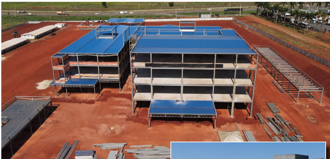
O Cora vai se somar ao Hospital Estadual do Centro Norte (HCN), em Uruaçu, e ao Hospital Estadual São Marcos, de Itumbiara, como unidades da gestão estadual que possuem serviço de Atenção Oncológica

Recentemente, a SES também anunciou que, em parceria com a UFG, permitirá a realização de sequenciamentos genéticos para detecção precoce