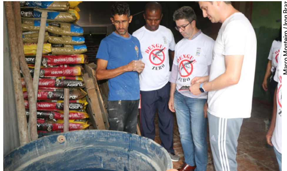
Situação de emergência por causa da dengue autoriza ações necessárias para evitar internações

Entre as medidas que podem ser determinadas,