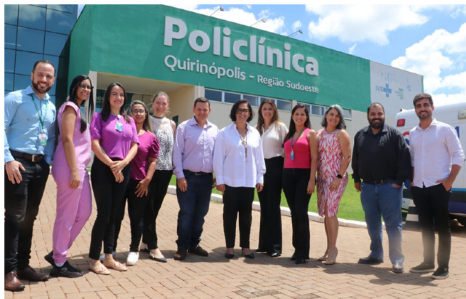
Participantes da capacitação para o Goiás Todo Rosa em Quirinópolis: processo será feito de forma criteriosa e envolverá médicos, enfermeiros e profissionais administrativos

O exame analisa todas as bases presentes nos genes BRCA 1 e 2, permitindo a identificação de mutações que podem causar câncer de mama e ovário. Ele pode ser feito a partir de uma simples amostra de sangue ou do