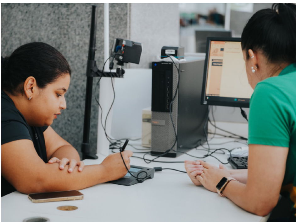
Novo documento possibilita mais verificações de segurança e busca prevenir fraudes

A identidade antiga segue válida até 2032, portanto, não é preciso correr para trocar imediatamente