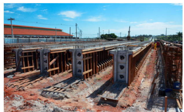
Obras do Viaduto Portal da Fé, em Trindade: cronograma de trabalho segue inalterado mesmo com as chuvas