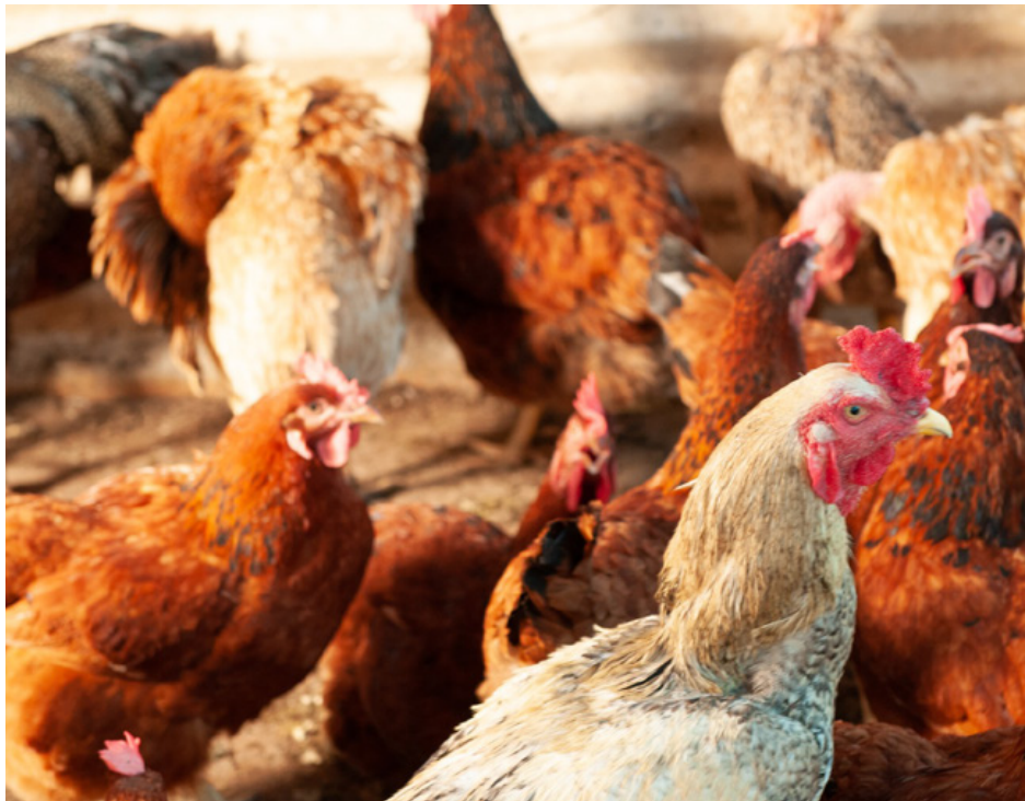
Sob vigilância da Agrodefesa, avicultura goiana segue sem registros de casos de Influenza Aviária