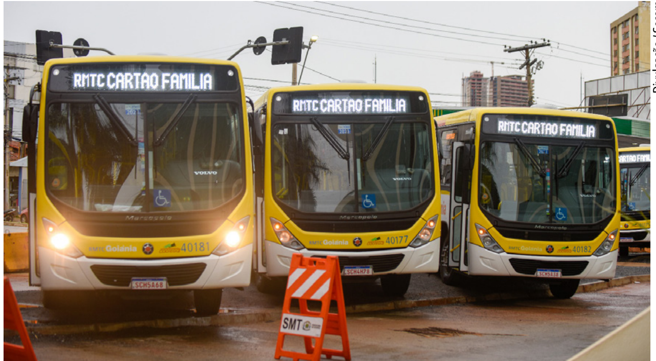
Ações do Governo de Goiás garantem maior satisfação do usuário com o preço da tarifa do transporte coletivo em Goiânia. Estado paga 41,2% do custo da passagem, e garante o valor de R$ 4,30, desde 2019

O convênio entre Estado e as prefeituras permitiu, além do congelamento da passagem, o lançamento de novos formatos de bilhetagem, como o Bilhete Único, o