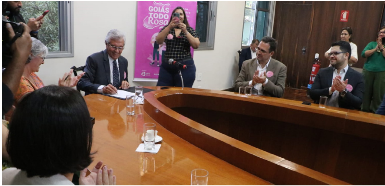
Governador Ronaldo Caiado em lançamento de parceria com a UFG para teste genético de detecção precoce de câncer de mama pelo SUS

“Terminou uma fila de mamografia, porém temos outra agora para os próximos meses. Isso já era esperado, porque todo trabalho feito em outubro foi também para ampliar a