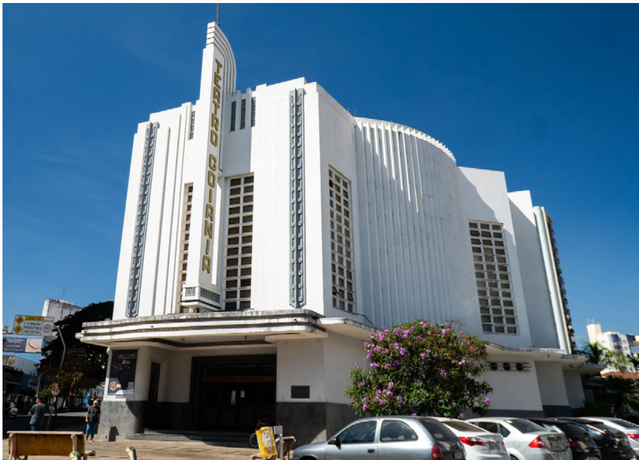
Projetos de engenharia para restauros do Teatro Goiânia e do Palácio Conde dos Arcos, na cidade de Goiás, estão entre as propostas incluídas no novo PAC