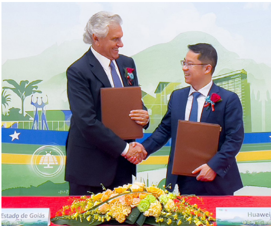
Com agenda intensa em seis cidades da China, governador Ronaldo Caiado traz na mala acordos de cooperação e expectativa de investimento em novas indústrias

A comitiva formada por secretários de estado, prefeitos, deputados e especialistas, além do próprio governador, conheceu ainda a montada chinesa