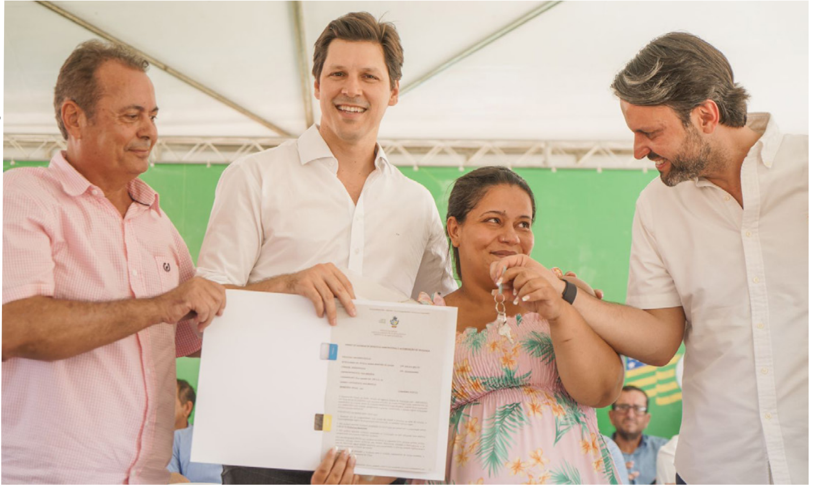
Daniel Vilela entrega moradias e destaca sensibilidade do governador Ronaldo Caiado em dar oportunidade para famílias criarem seus filhos onde estão suas raízes

O governador em exercício Daniel Vilela entregou nesta terça-feira (14/11), em Moiporá e Iporá, no Oeste goiano, 96 unidades habitacionais do Programa Pra Ter Onde Morar – Construção. Nos dois empreendimentos, executados pela Agência Goiana de Habitação (Agehab) e Secretaria da Infraestrutura (Seinfra), foram investidos cerca de R$ 10 milhões.