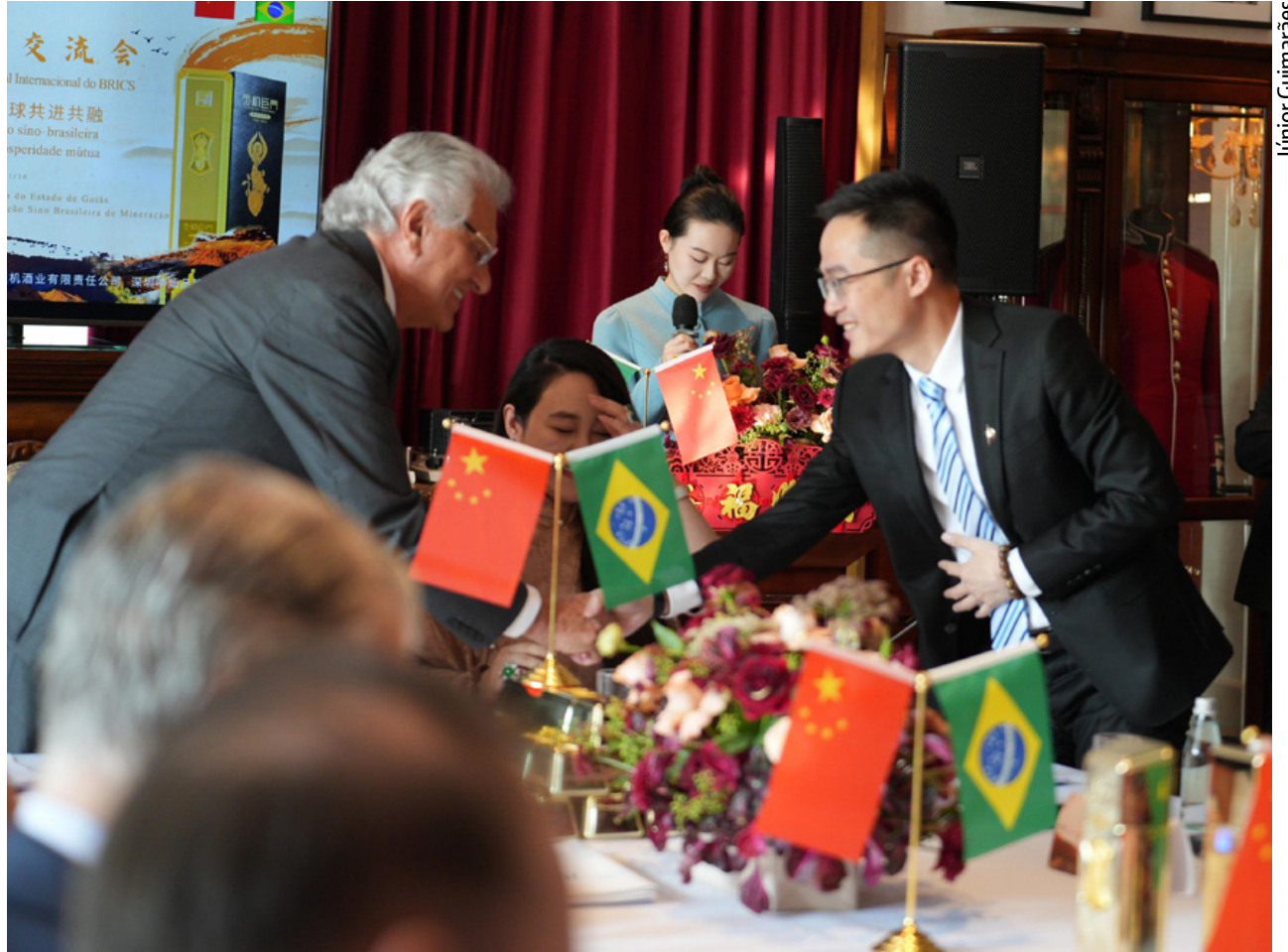
Governador Ronaldo Caiado apresenta potencialidades de Goiás a gigante chinesa da área de infraestrutura, engenharia e mineração