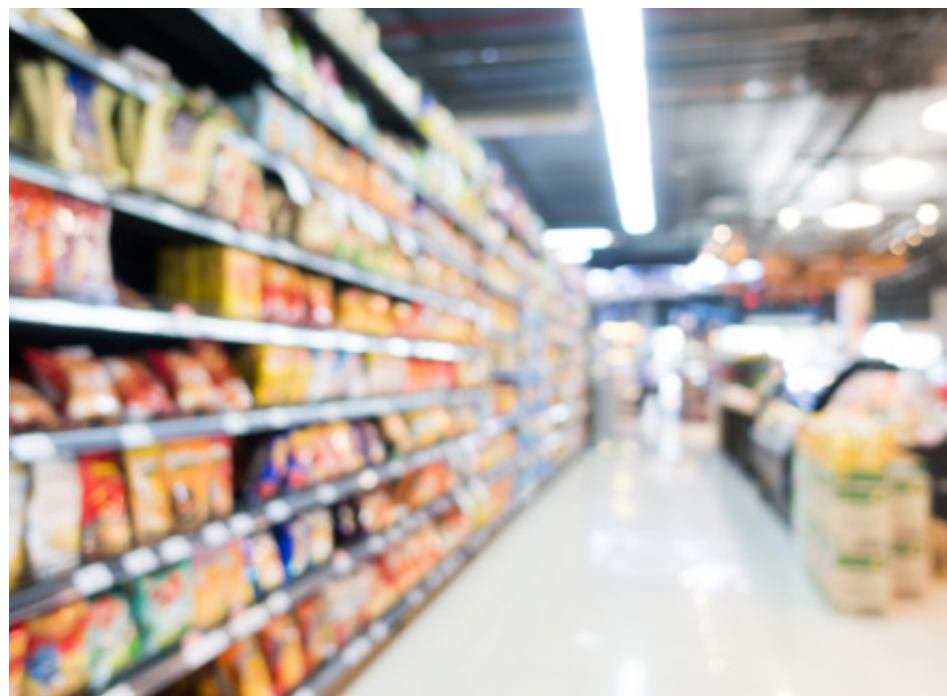
Supermercados puxam alta nas vendas do comércio varejista em Goiás: segmento é grande gerador de empregos

Já do ponto de vista da economia, o bom desempenho do comércio se soma a outros resultados positivos. "Goiás também registrou 31 meses con-