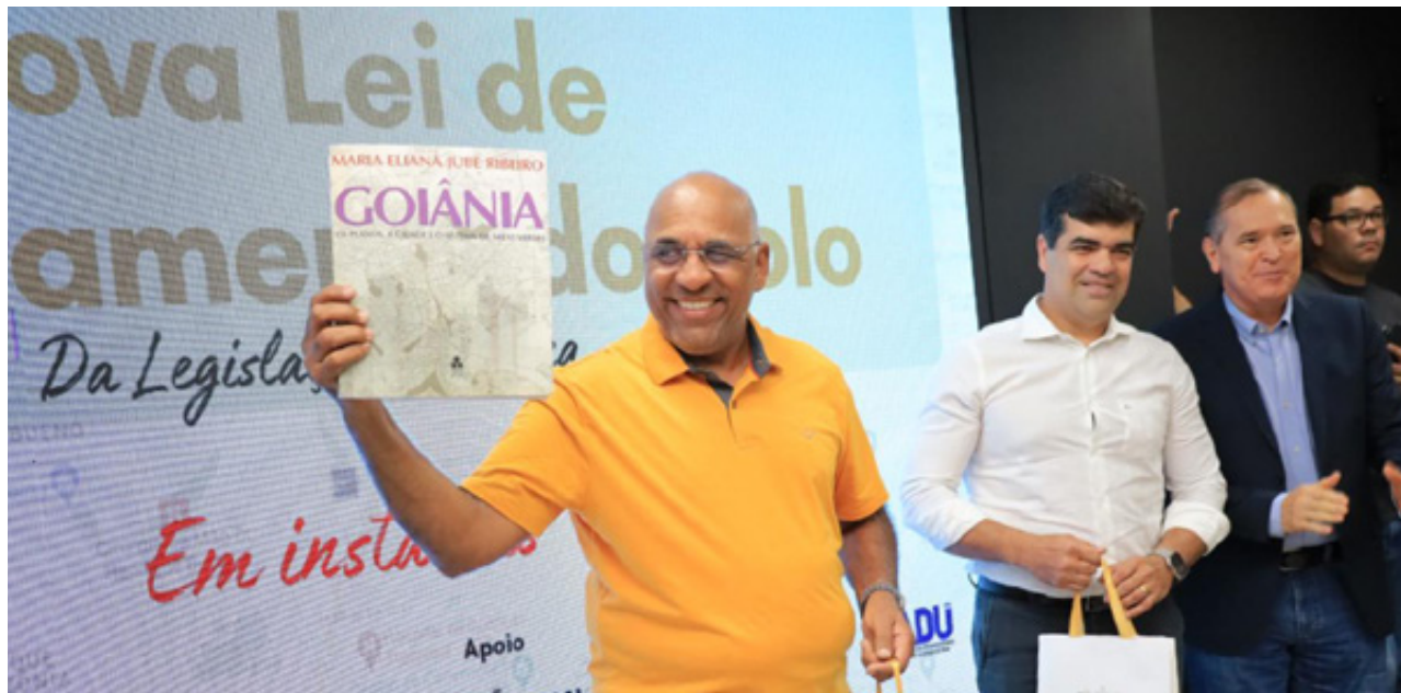
Cruz abre curso voltado para profissionais que atuam na área de urbanismo na Capital: formação tem como foco a nova lei de parcelamento do solo

Com três módulos, o curso irá abordar as mudanças trazidas pelo novo