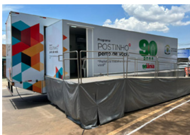
Prefeitura disponibiliza carretas com equipes da Estratégia de Saúde da Família (ESF) para absorver pacientes não urgentes

As carretas vão receber pacientes classificados como não urgentes, com fichas azuis e verdes, durante um período de adaptação, a partir da próxima segunda-feira (13/11), cada uma contendo três consultórios e uma sala de medicação, com o objetivo de orientar e encaminhar os pa-