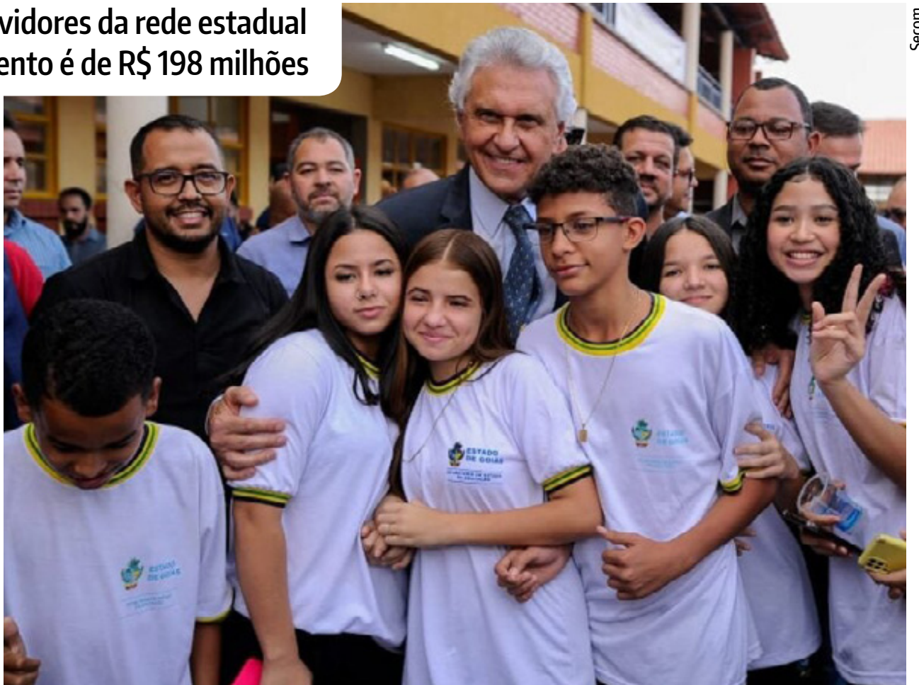
Governador Ronaldo Caiado participa de evento com servidores e estudantes da rede estadual: bônus por resultado está garantido

Este é o terceiro ano seguido em que o bônus é pago aos servidores da Educação. Entre outros benefícios, todos os trabalhadores da rede recebem, para além do salário e vantagens pessoais próprias da carreira, os auxílios alimentação e aprimoramento no valor total de R$ 1 mil.