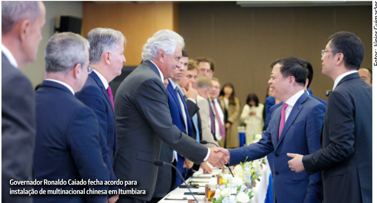
Governador Ronaldo Caiado fecha acordo para instalação de multinacional chinesa em Itumbiara

“Nossa vinda aqui tem um objetivo: fazer com que possamos ampliar os investimentos de empresas de tecnologia em Goiás garantindo maior acesso a produtos essenciais, como energia sustentável, ao mesmo tempo em que ampliamos a oferta de empregos qualificados e