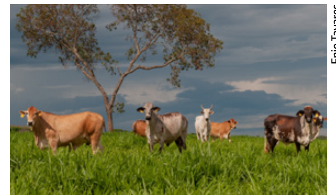
PIB goiano deve atingir maior nível de atividade econômica da história pelo segundo ano consecutivo

Até julho deste ano, foi constatado a geração de cerca de 70 mil empregos formais no Estado, conforme dados divulgados pelo Cadastro Geral de Empregados e Desempregados (Caged). Os números estão associados a um crescimento de 14,3% na renda média do trabalhador goiano no 2º trimestre de 2023. No período, também foi evidenciado a