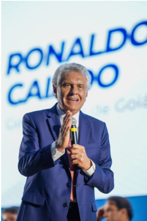
Em evento empresarial, Ronaldo Caiado destaca potencial da economia anapolina: “grande potência”

O prefeito de Anápolis, Roberto Naves, agradeceu ao governador pela retomada dos eventos no Centro de Convenções de Anápolis (CCA) e destacou a importância da feira para a continuidade dos resultados econômicos positivos. “Anápolis é uma grande potência. A feira impulsio-