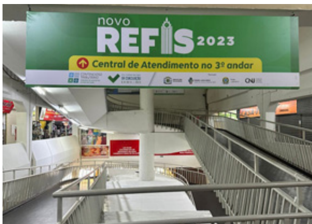
Mercado Municipal passa por reforma para a realização do Refis 2023: estimativa é atender cerca de 1.500 contribuintes por semana

Pela primeira vez, uma edição do Refis é realizada em um mercado popular de