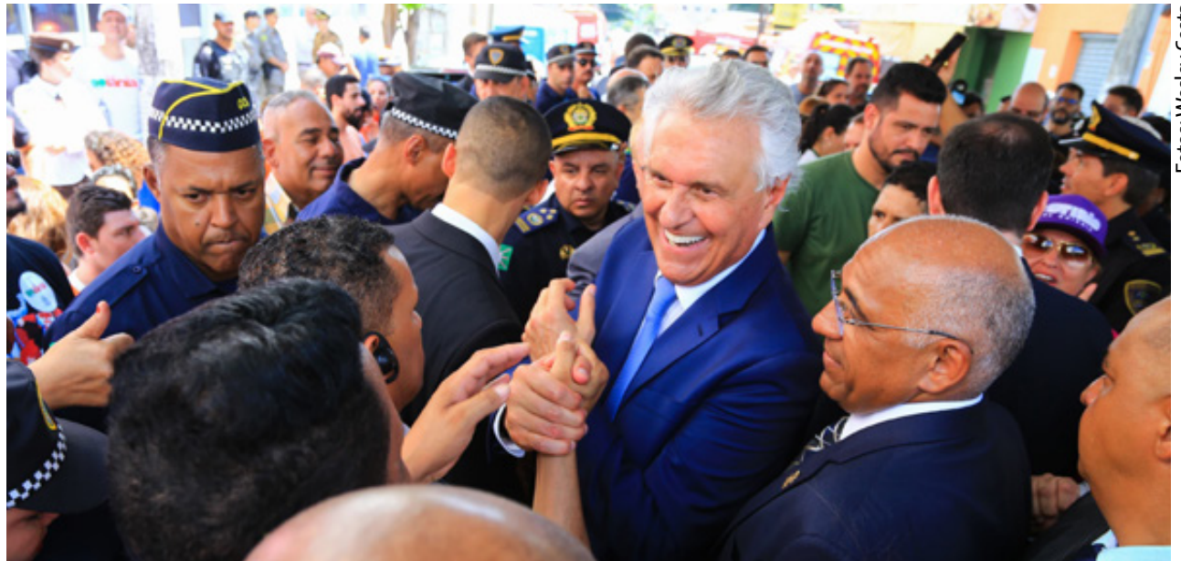
Goiânia 90 anos: governador Ronaldo Caiado acompanha desfile cívico-militar e recebe carinho da população, em Campinas