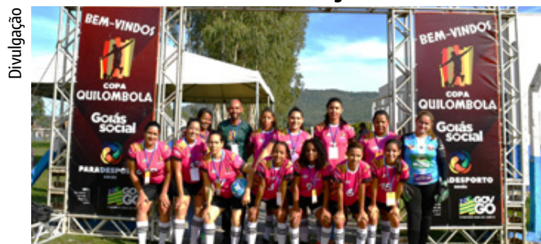
Divulgação Goiânia sedia fase final da 2ª edição da Copa Quilombola ESPORTE | 8