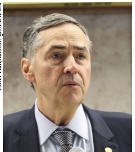
Valter Campanato/Agência Brasil

Poderes vivem “parceria”, diz ministro Barroso nos 35 anos da Constituição