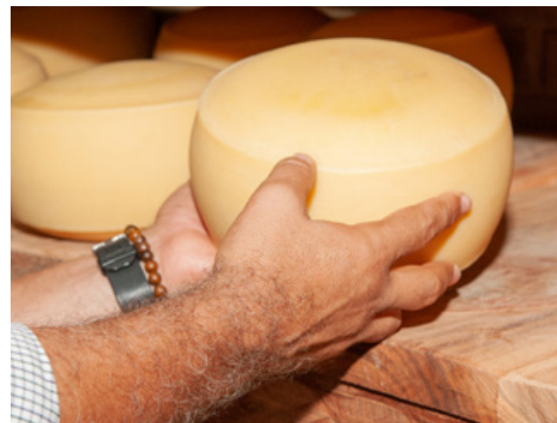
Produtos artesanais devem ser produzidos de forma manual, a partir de matéria-prima própria ou de origem determinada

queijos artesanais foram elaborados por métodos tradicionais com vinculação e valorização territorial, regional ou cultural. Com as certificações, assegura-se que os produtos têm propriedades organolépticas (como cor e cheiro) únicas, diferenciadas e inerentes ao "fazer artesanal" próprio de determinada região, tradição ou cultura.