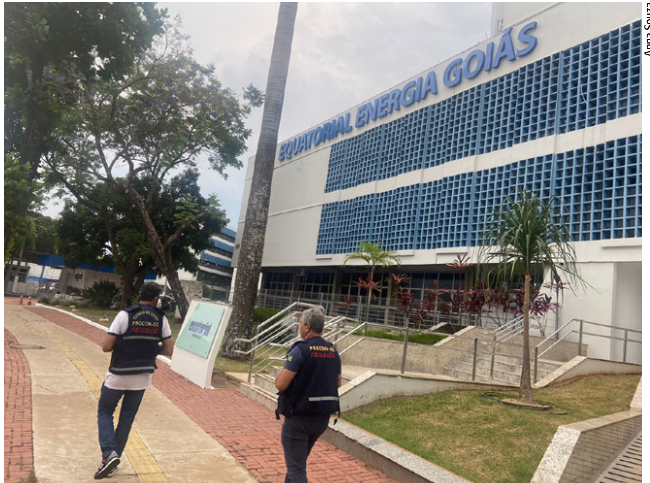
Fiscais do Procon autuam a concessionária de energia Equatorial após empresa não apresentar esclarecimentos solicitados pelo órgão de defesa do consumidor

A partir de agora será instaurado pela Superintendência um Processo Sancionatório para apurar as responsabilidades da Equatorial por má prestação de serviço. Em seguida, a empresa terá o prazo de 20 dias para apresentar defesa e poderá ser penalizada com uma multa administrativa cujo valor pode chegar até R$ 11 milhões.