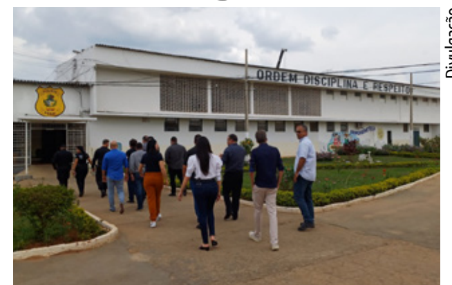
Segurança Pública de Goiás recebe comitiva de inteligência da Bahia

Os servidores da Bahia também visitaram o Complexo Prisional de Apare-