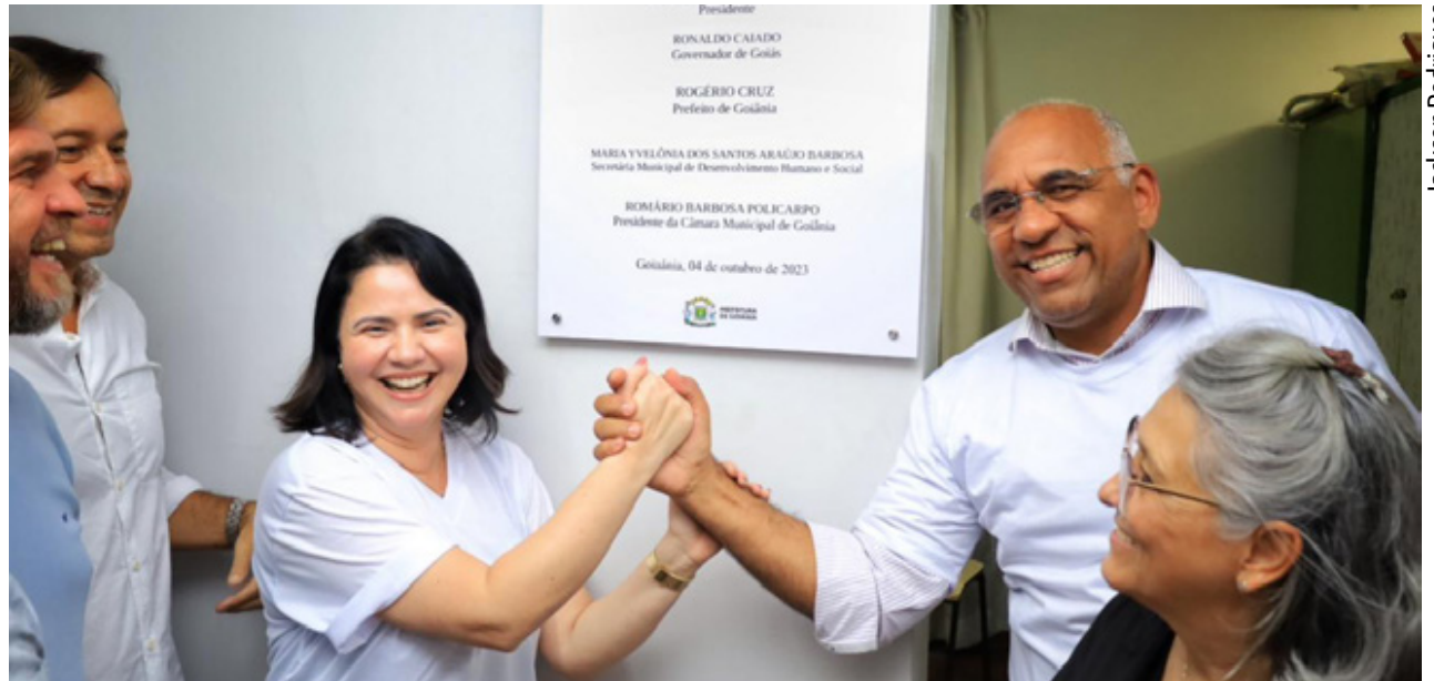
Prefeito entrega Cras Santo Afonso, na Vila Aurora Oeste, após reordenamento da unidade: outras oito unidades também serão transformadas

“Esse é mais um trabalho que estamos realizando em parceria com o Governo Federal. Com essa unidade transformada em Cras, os atendimentos serão ampliados, além das possibilidades de investimentos que a uni-