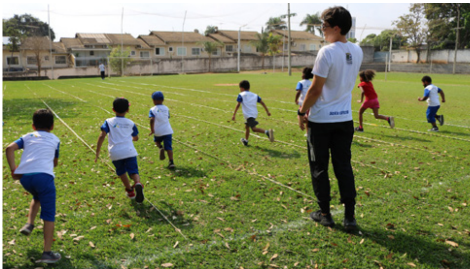
Secretaria Municipal de Educação de Goiânia promove, nesta quarta (27/9) e quinta-feira, 28, o Festival de Atletismo Mirim, com a participação de cerca de 750 crianças da rede municipal de ensino da Capital

Crianças de 26 instituições educacionais participarão das vivências nas provas de atletismo, como salto em altura, arremesso de pelota, corridas e salto em distância. O Festival de Atletismo Mirim é a segunda modalidade dos