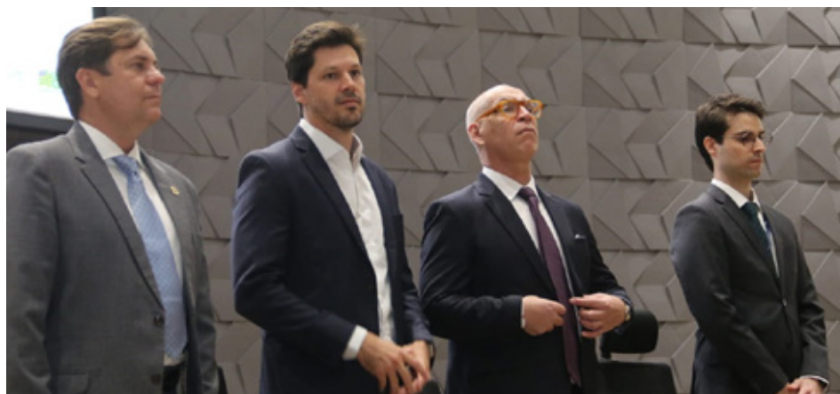
Ministério da Saúde e SES fecham parceria: Goiás será modelo com sistema de fila única de cirurgias eletivas

Esse sistema fará parte da RNDS e está sendo avaliado, na parceria do MS com a SES, tanto o uso da