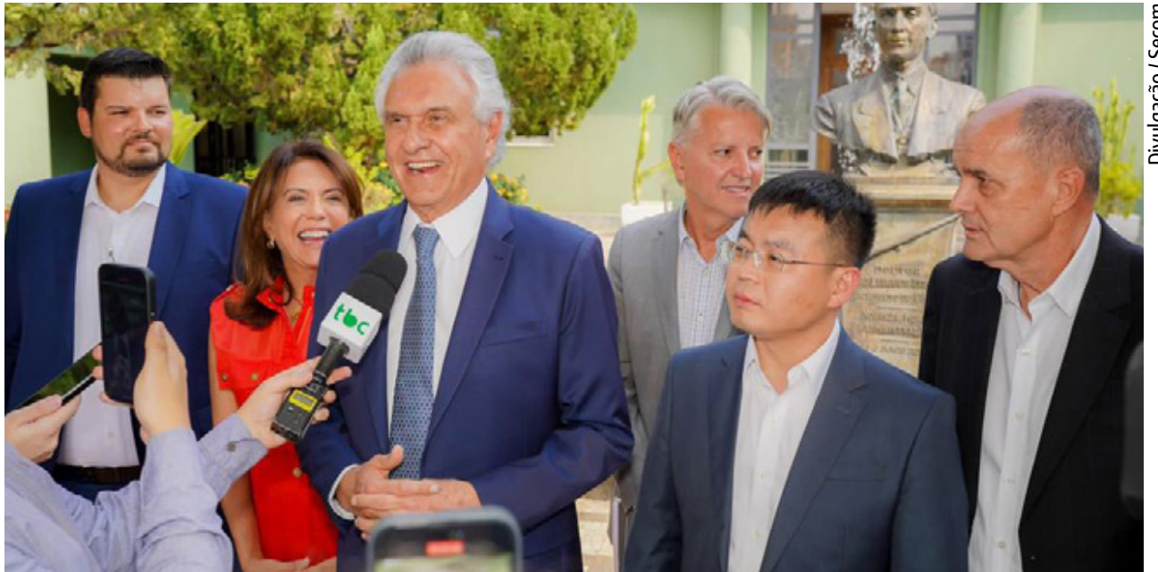
Ronaldo Caiado e comitiva chinesa da Weichai Power acertam detalhes para instalação de fábrica em Itumbiara, no Sul do estado

mente o conceito de Goiás, deixará de ser um importador de motores, para se tornar produtor, capaz de ofertar para todo o Brasil por sua condição geográfica”, comentou Caiado. O governador ressaltou que uma equipe do Governo de Goiás trabalha na articulação para efetivar o acordo, prestando informações sobre legislação e dados da indústria e comércio. O governador estava acompanhado da presidente de honra da Organização das Voluntárias de Goiás (OVG) e coordenadora do Gabinete de Políticas Sociais (GPS), primeira-