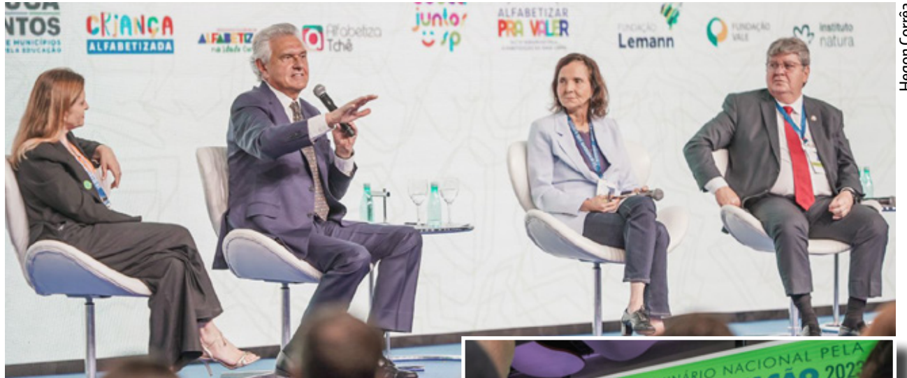
Caiado apresenta “mudança significativa” na educação goiana

Para o chefe do Executivo, a política educacional cearense foi uma importante referência para avanços promovidos em Goiás por meio do AlfaMais. O principal resultado é o aumento do índice de proficiência avançada em Português e Matemática, que passou de 49% para 56% entre 2021 e 2022. De acordo com ele, outras medidas, como compra de