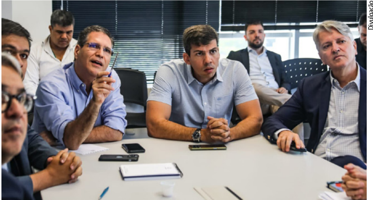
Comissão multissetorial formada por Codego, Seinfra e Sic vai definir critérios técnicos para instalação de empresas nos distritos agroindustriais