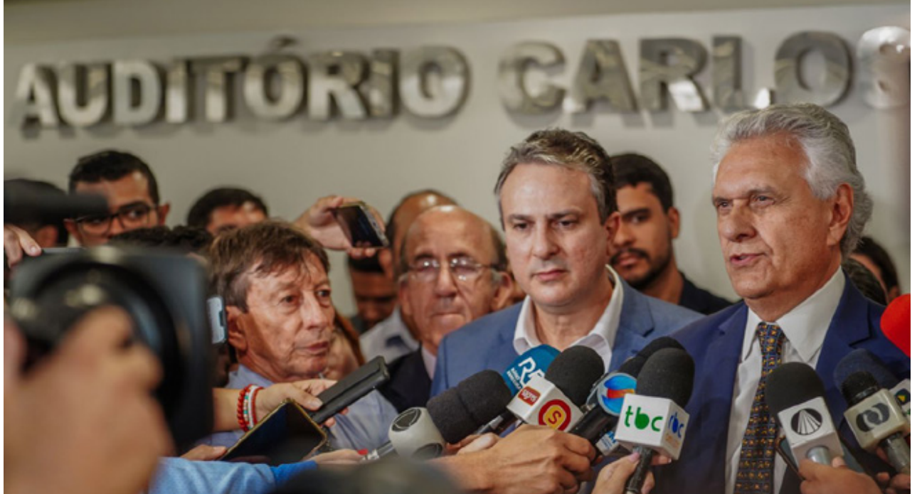
Caiado, ao lado do ministro da Educação, Camilo Santana, durante anúncio da adesão de Goiás a programas educacionais do governo federal

Goiás vai receber R$ 103 milhões em recursos da União para retomar e concluir 120 obras de escolas públicas em 77 municípios. O compromisso foi firmado nesta terça-feira (05/09), em cerimônia com a participação do governador Ronaldo Caiado e do ministro da Educação, Camilo Santana, na sede da Assembleia Legislativa de Goiás, em Goiânia. A solenidade marcou a adesão do estado ao Pacto Nacional pela Retomada de Obras da Educação Básica e a outras duas iniciativas federais: o Compromisso Nacional Criança Alfabetizada e o Programa Escola em Tempo Integral.