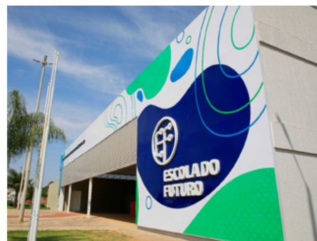
Escolas do Futuro abrem vagas para cursos técnicos de Desenvolvimento Web e Mobile e Marketing e Mídias Sociais

As EFGs foram criadas pela lei nº 20.976/2021, com operacionalização mediante convênio firmado