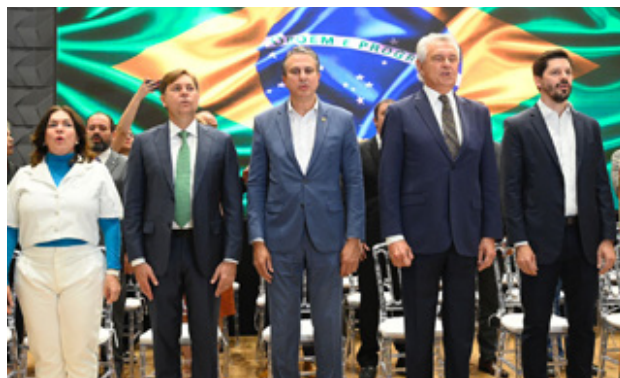
Vice-governador participou da cerimônia de assinatura do Pacto nacional pela Retomada das Obras da Educação Básica, com presença do ministro Camilo Santana

O Estado vai receber cerca de R$ 103 milhões de investimentos em obras de escolas da rede pública estadual e municipais. O recurso é proveniente do Pacto Nacional pela Retomada das Obras da Edu-