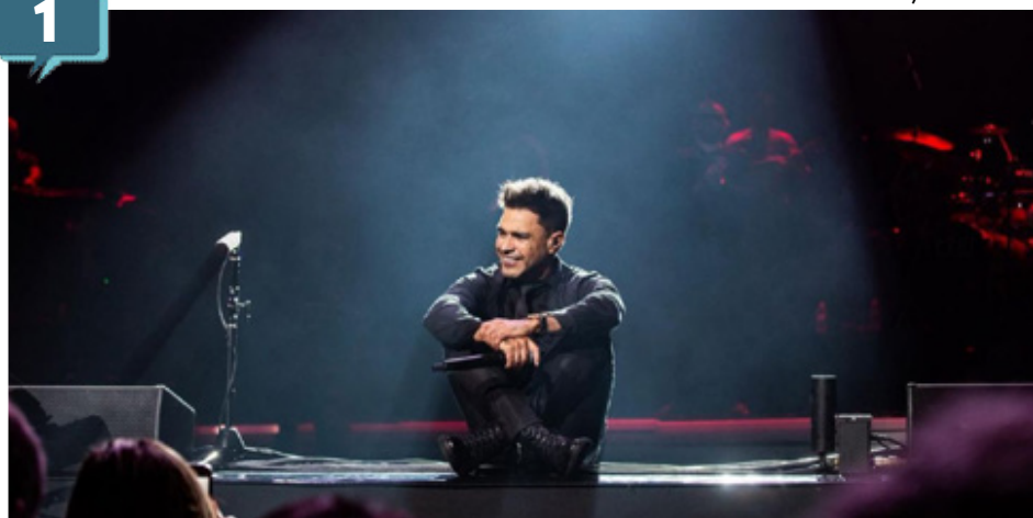
Zezé Di Camargo