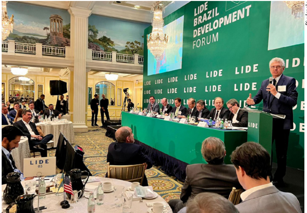
Governador Ronaldo Caiado viaja aos Estados Unidos para representar Goiás em evento do setor produtivo: estado busca investimentos

taduais e municipais, o presidente do Congresso Nacional, senador Rodrigo Pacheco, e o presidente do Banco Central, Roberto Campos Neto, também participam do Lide Brazil. Caiado destacou a disposição de Pacheco em acolher as ponderações sobre o texto da reforma tributária e defender os entes federados, e ressaltou a necessidade de cautela diante do cenário econômico global. “O momento é de sensatez, equilíbrio, pon-