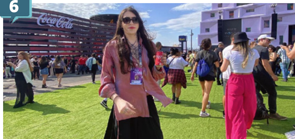
Boss in Drama