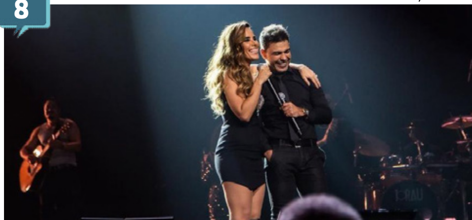
Zezé Di Camargo e Wanessa