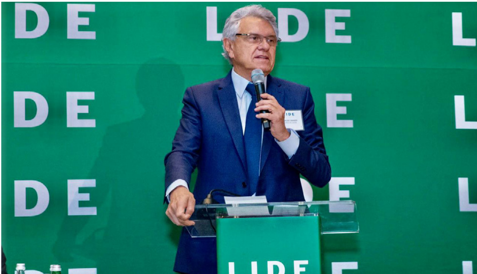
Governador foi um dos convidados do Lide Brazil para participar de conferência com lideranças políticas e empresariais, em Washington