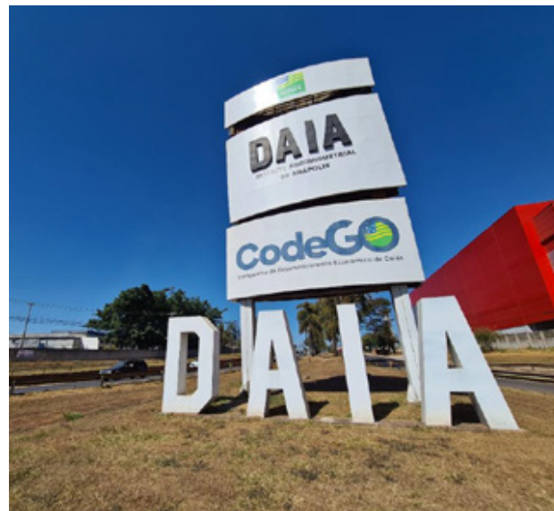
Codego e UFG vão oferecer cursos de pós-graduação a trabalhadores do Daia a partir de outubro