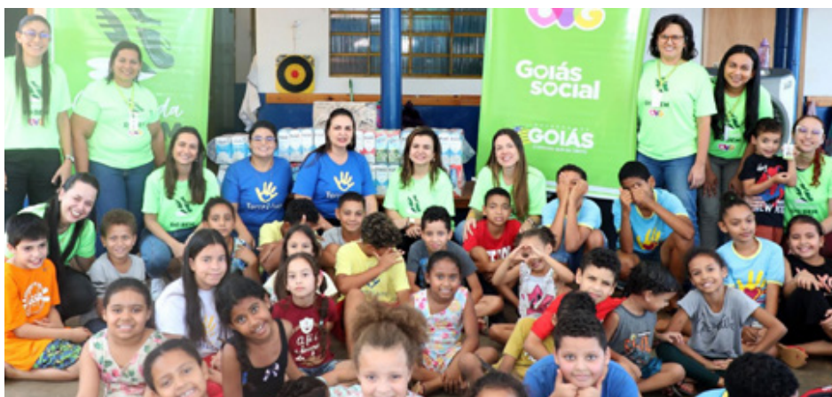
OVG repassa doação de mais de mil litros de leite arrecadados na Caminhada do Bem a quatro entidades sociais

“O governador Ronaldo Caiado sempre diz que ninguém faz nada sozinho. Ajudar a fortalecer os laços de solidariedade é uma das preocupações do Governo de Goiás, por isso eu faço questão de agradecer a cada pessoa que esteve conosco na Caminhada do Bem, nos ajudando a arrecadar esses mais de mil litros de leite