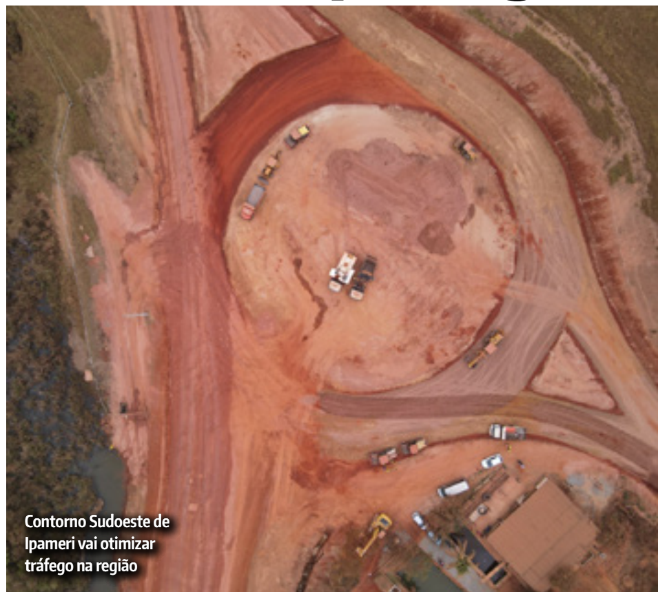
Contorno Sudoeste de Ipameri vai otimizar tráfego na região

Para além dos aprimoramentos socioeconômicos, a obra também foi planejada para dar fluidez ao tráfego do perímetro urbano da cidade, conferir celeridade a viagens de grandes distâncias e promover economia de combustível a todos os usuários, que também serão beneficiados com menor tempo de percurso.