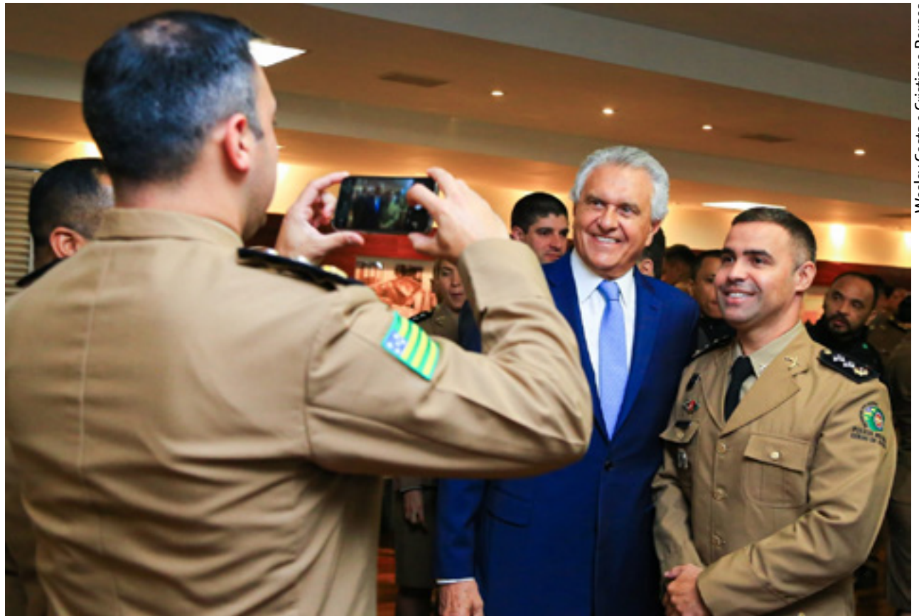
Governador Ronaldo Caiado e primeira-dama Gracinha Caiado recebem, em sua residência oficial, militares recém-promovidos da PMGO

Na oportunidade, o governador também agradeceu o trabalho da tropa na segurança pública, destacando que Goiás é referência nacional no combate à criminalidade. Segundo a Secretaria de Segurança Pública (SSP), no primeiro semestre deste ano houve queda de 80% no número de latrocínios no estado, em relação ao mesmo período do ano passado.