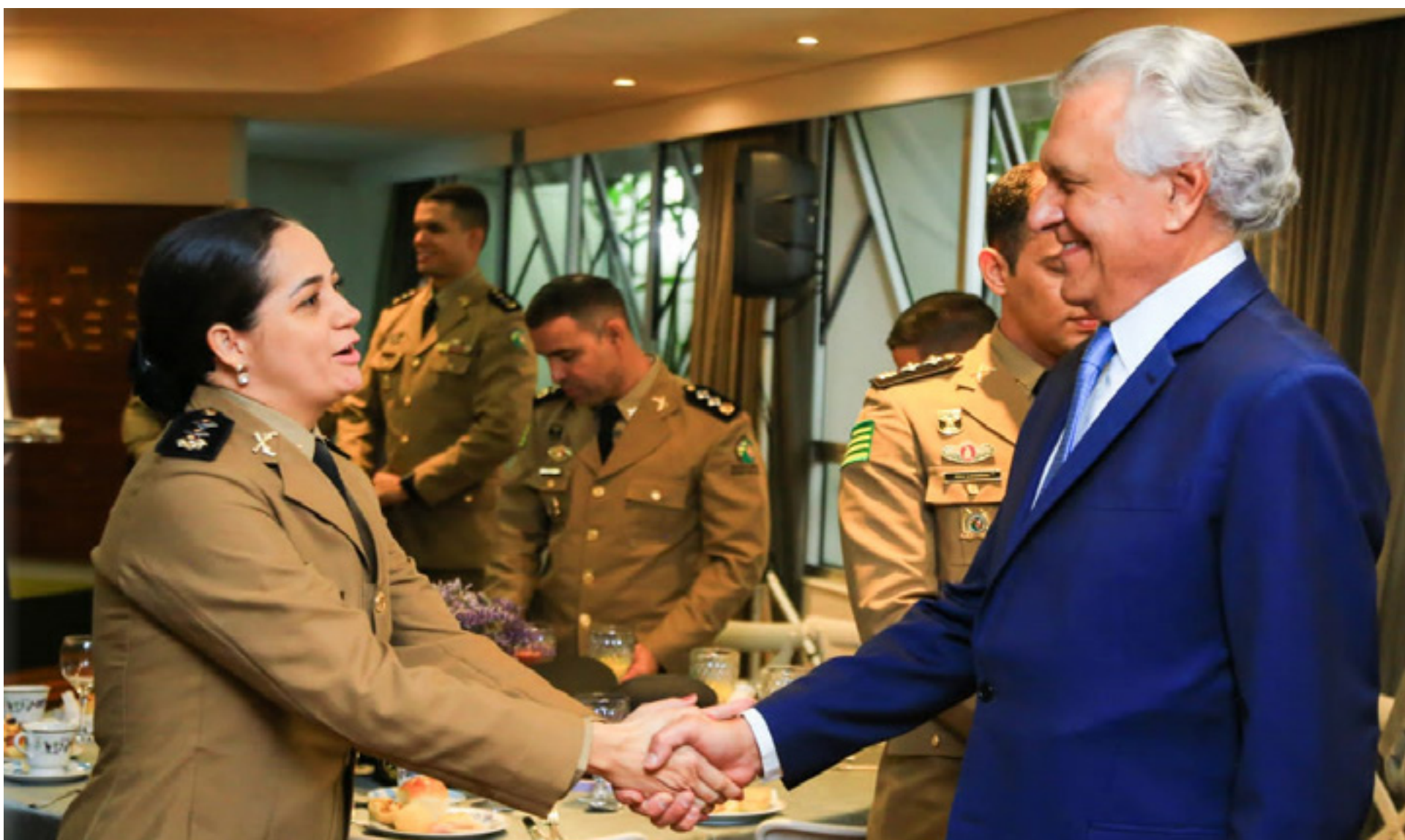
Corporação promove 391 militares com avanços na carreira de oficial