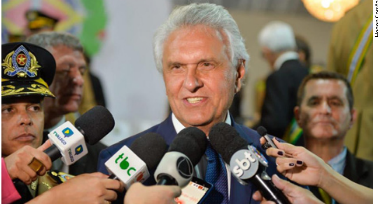
Governador Ronaldo Caiado e primeira-dama Gracinha participam de solenidade em homenagem aos 165 anos da PMGO

As estatísticas apontam também que 128 municípios goianos não registraram homicídio doloso no 1º semestre de 2023 e em 97 não ocorreram crimes violentos contra o patrimônio no mesmo período. Em relação aos crimes contra instituições financeiras, Goiás continua com registro zerado. O governador Ronaldo Caiado ressaltou que os bons resultados alcançados são fruto da determinação e integração das forças policiais e ações de inteligência.