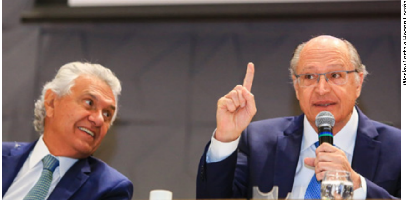
Caiado acompanha vice-presidente da República em visita a Goiânia. Alckmin ouviu demandas do setor produtivo e de agentes públicos

Para incrementar ainda mais o crescimento do Estado, o governador Ronaldo Caiado solicitou ajuda do governo federal para a instalação de um gasoduto.