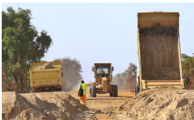
Obra de pavimentação da GO-454, no trecho que liga a GO-164 à divisa entre Goiás e Mato Grosso, na cidade de Cocalinho, recebeu investimentos de mais de R$ 64 milhões