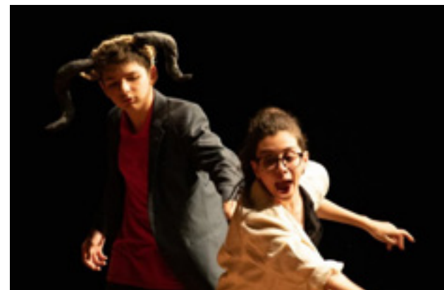
Teatro é modalidade contemplada por cursos de qualificação da EFG Basileu França

A EFG em Artes Basileu França é uma instituição