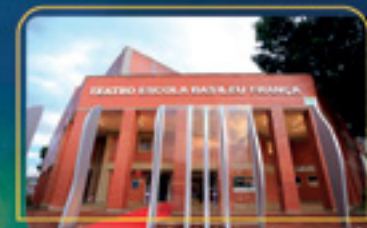
Teatro Escola Basileu França