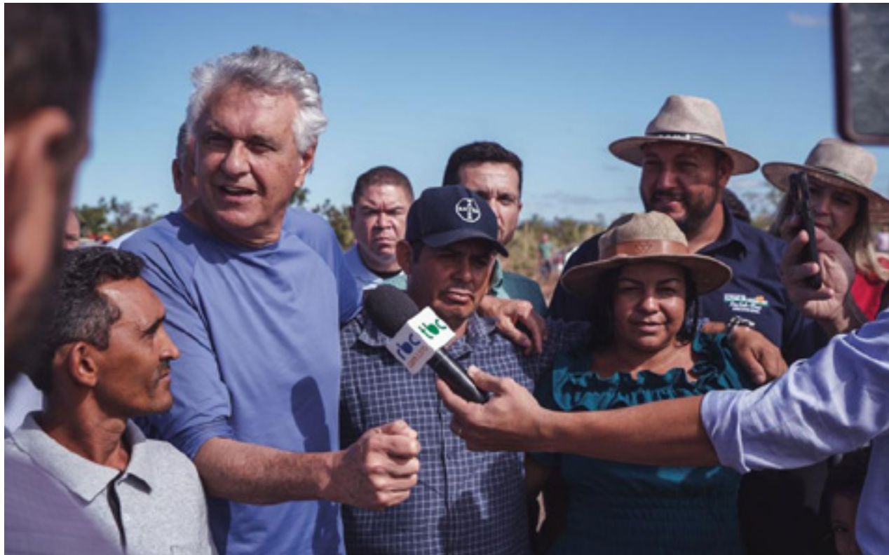
Governador Ronaldo Caiado durante vistoria em assentamento do Projeto de Fruticultura Irrigada do Vão do Paranã, no Nordeste goiano: iniciativa recebe investimentos de mais de R$ 10 milhões

A iniciativa conta com investimentos de R$ 11,3 milhões e é uma parceria que envolve o Ministério da Integração e do Desenvolvimento Regional (MIDR), a Companhia de Desenvolvimento dos Vales do São Francisco e do Parnaíba (Codevasf), o Senar Goiás, a Universidade Federal de Goiás (UFG), a Organização das Cooperativas do Brasil (OCB), a Emater e as prefeituras municipais de Formosa,