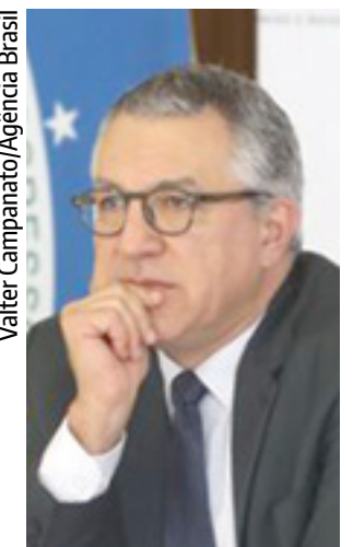
Ministro da Secretaria de Relações Institucionais, Alexandre Padilha,

O Conselho foi criado em 2003, no primeiro mandato de Lula, e funcionou até ser extinto em 2019. Em maio deste ano, Lula assinou o decreto que retomou o trabalho do órgão, que reúne 247 representantes de diversos seguimentos da sociedade.