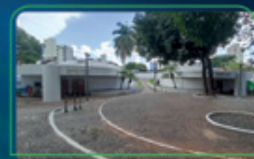
Centro Cultural Martim Cererê