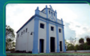
Igreja Nossa Senhora Aparecida do Povoado de Areias