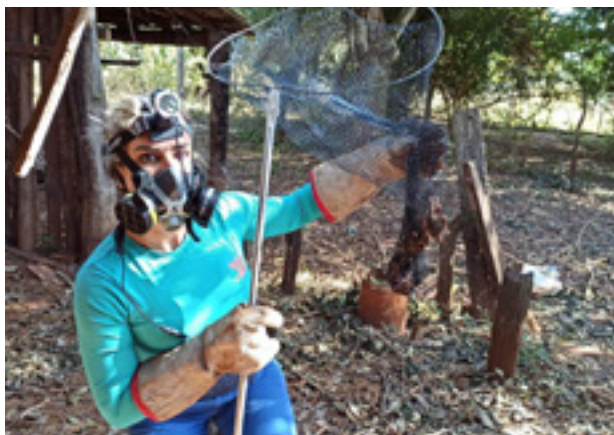
Captura dos morcegos é feita a partir de notificações de espoliação e por meio de fiscalizações e vigilâncias dos fiscais estaduais agropecuários