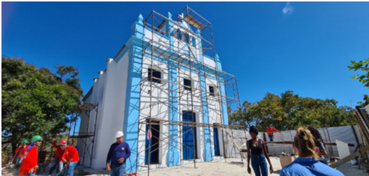
Governo de Goiás investe R$450 milhões no setor cultural em 5 anos. Somente em 2023, o aporte já ultrapassa R$54 milhões

Com investimento de R$ 1,7 milhão, a Igreja Nossa Senhora de Aparecida, no antigo povoado de Areias, na cidade de